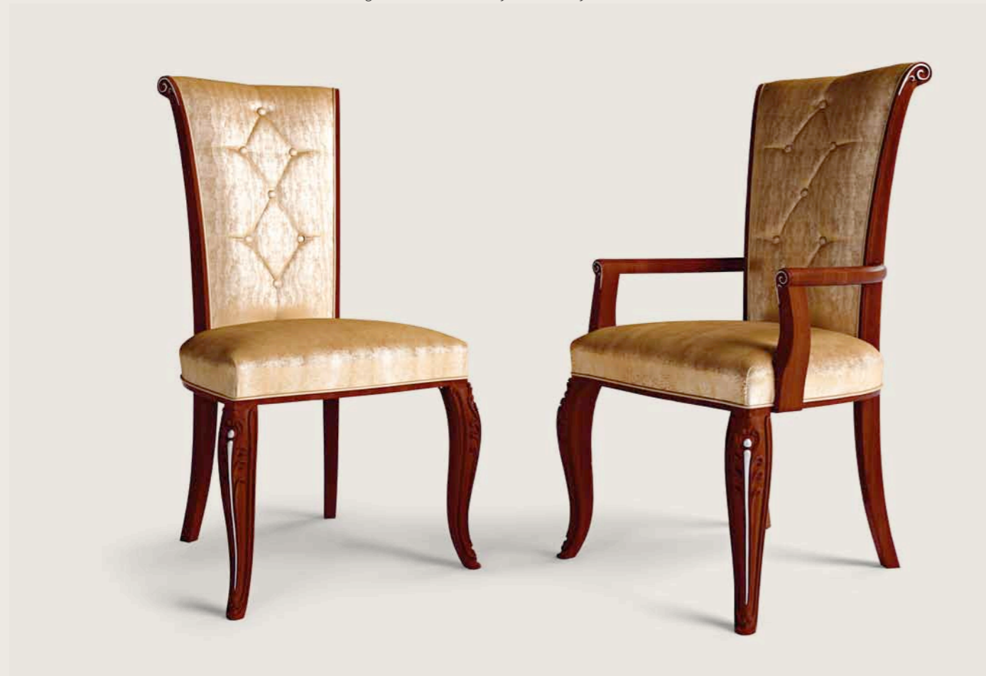
Art. E-906 Sedia senza cimasa Chair, without cresting rail Cm. 57 x 63 x h. 108

The armchair and chair from the Princess Collection – truly sophisticated pieces that wonderfully adapt to any need for space, without going against those universal standards of elegance that only true style can offer.