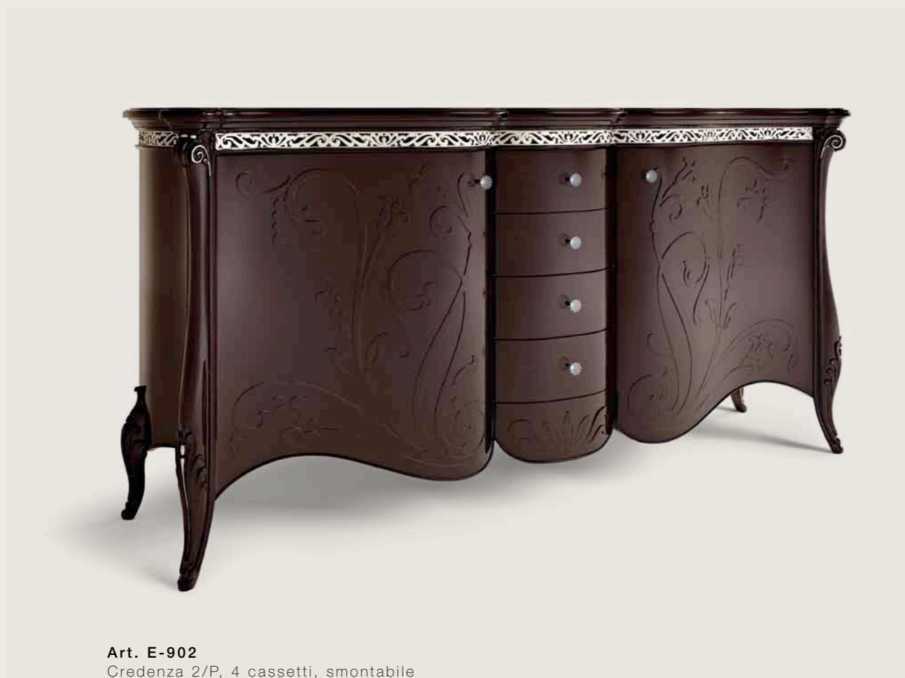
Art. E-902 Credenza 2/P, 4 cassetti, smontabile 2-door sideboard with 4 drawers. Easily disassembled. Cm. 222 x 59 x h. 112

Our experience leads to furnishings that truly draw you in, even if you are one of the most demanding connoisseurs. These furnishings are the expression of a furnishing culture that combines formal quality with the desire to reinterpret classic styles in a modern key.