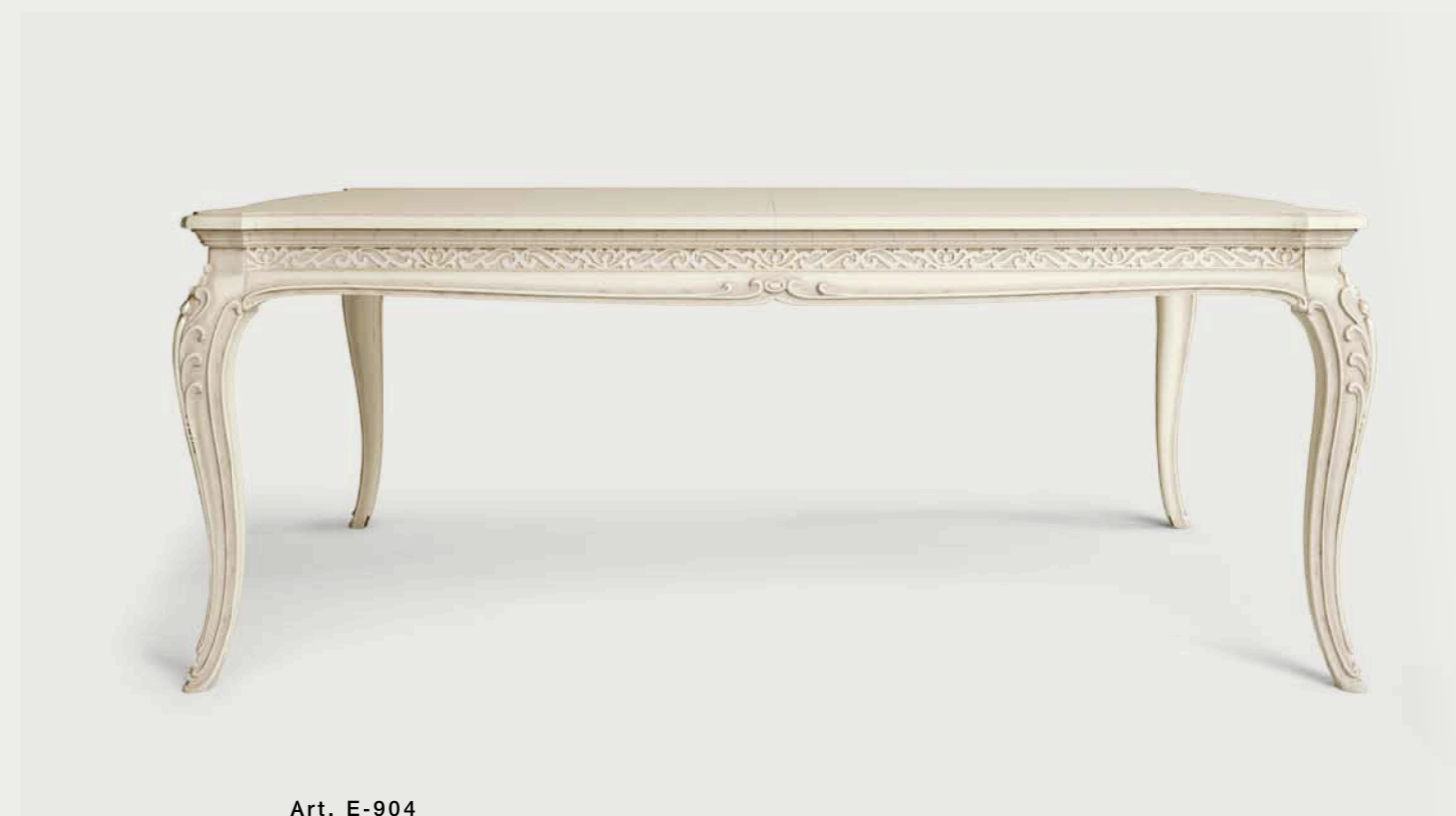
Art. E-904 Tavolo rettangolare allungabile Extendible rectangular table Cm. 200 x 115 x h. 79 (Cm. 300 x 115 aperto, open)

We believe in quality, the choice of materials and workmanship techniques - to create this furniture we use only top quality wood, and the carvings are handmade by experienced artisan masters who know and love wood and all its secrets.