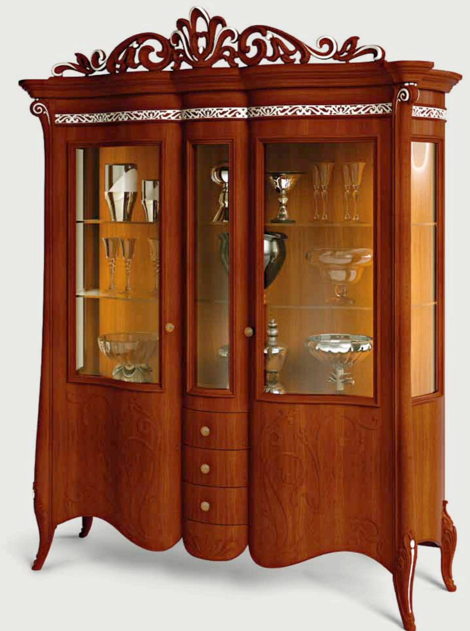
Art. E-901 Vetrina 2/P, 3 cassetti con cimasa intagliata, smontabile 2-door showcase with 3 drawers and carved cresting rail. Easily disassembled. Cm. 181 x 56 x h. 233