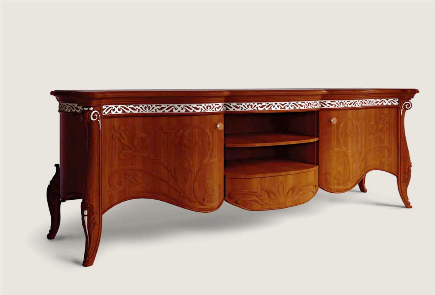
Art. E-911 Base porta tv con ripiano inferiore estraibile, smontabile TV console base with pull-out lower shelf. Easily disassembled. Cm. 207 x 55 x h. 73

Classic style and practicality come together in the quality of this TV console – the home rediscovers its identity and style – where values are perfectly combined with logic and usefulness.