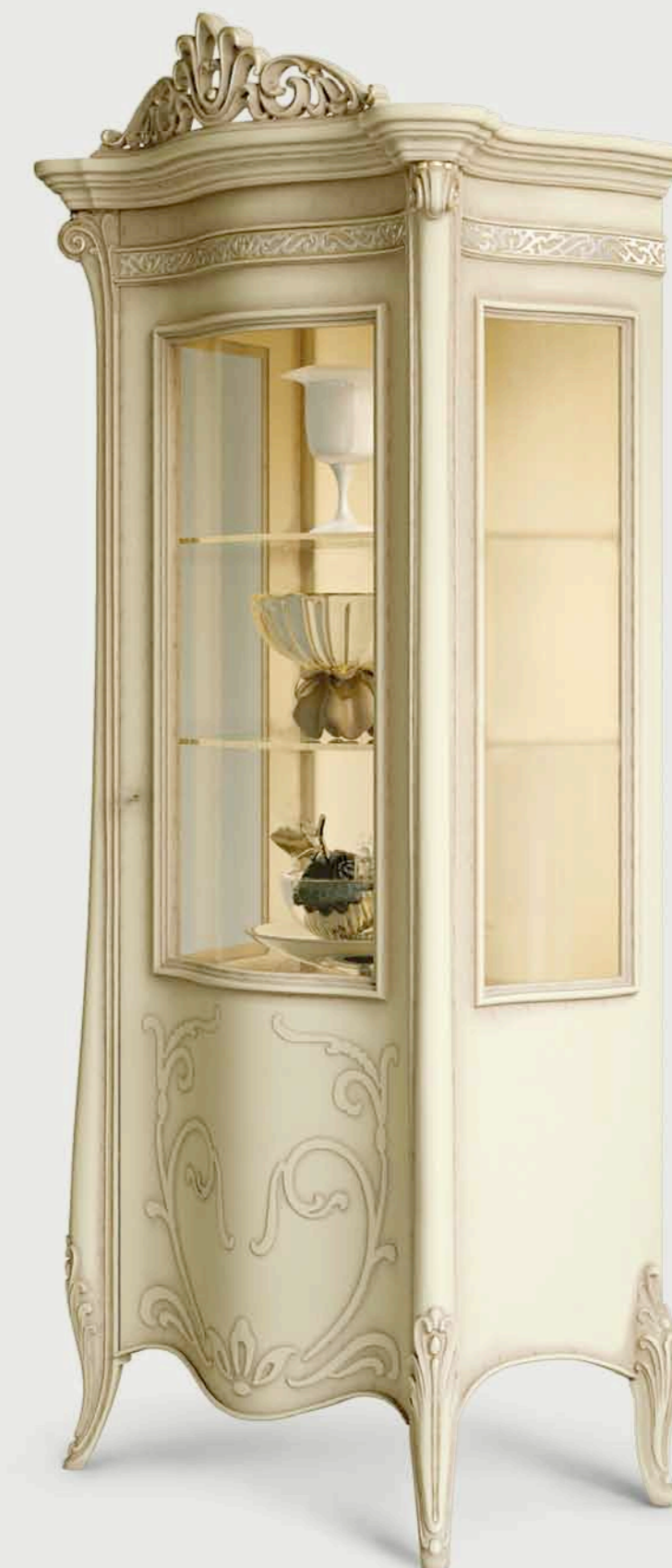
Art. E-910 Vetrina 1/P, con cimasa intagliata, smontabile. Versione dx e sx 1-door showcase with carved cresting rail. Easily disassembled Right and left version Cm. 96 x 56 x h. 227

The exclusiveness of the Princess collection represents the classic themes of Baroque style – truly timeless.