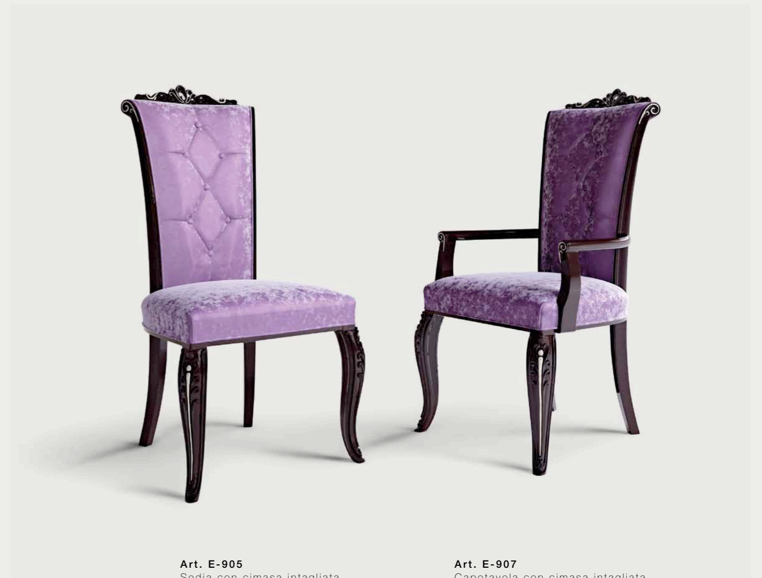
Art. E-905 Sedia con cimasa intagliata Chair with carved cresting rail Cm. 57 x 63 x h. 114

The combination of historical research and craftsmanship leads to the creation of furnishings defined by a style that gives the house a new elegance, that perfect balance between past and present.