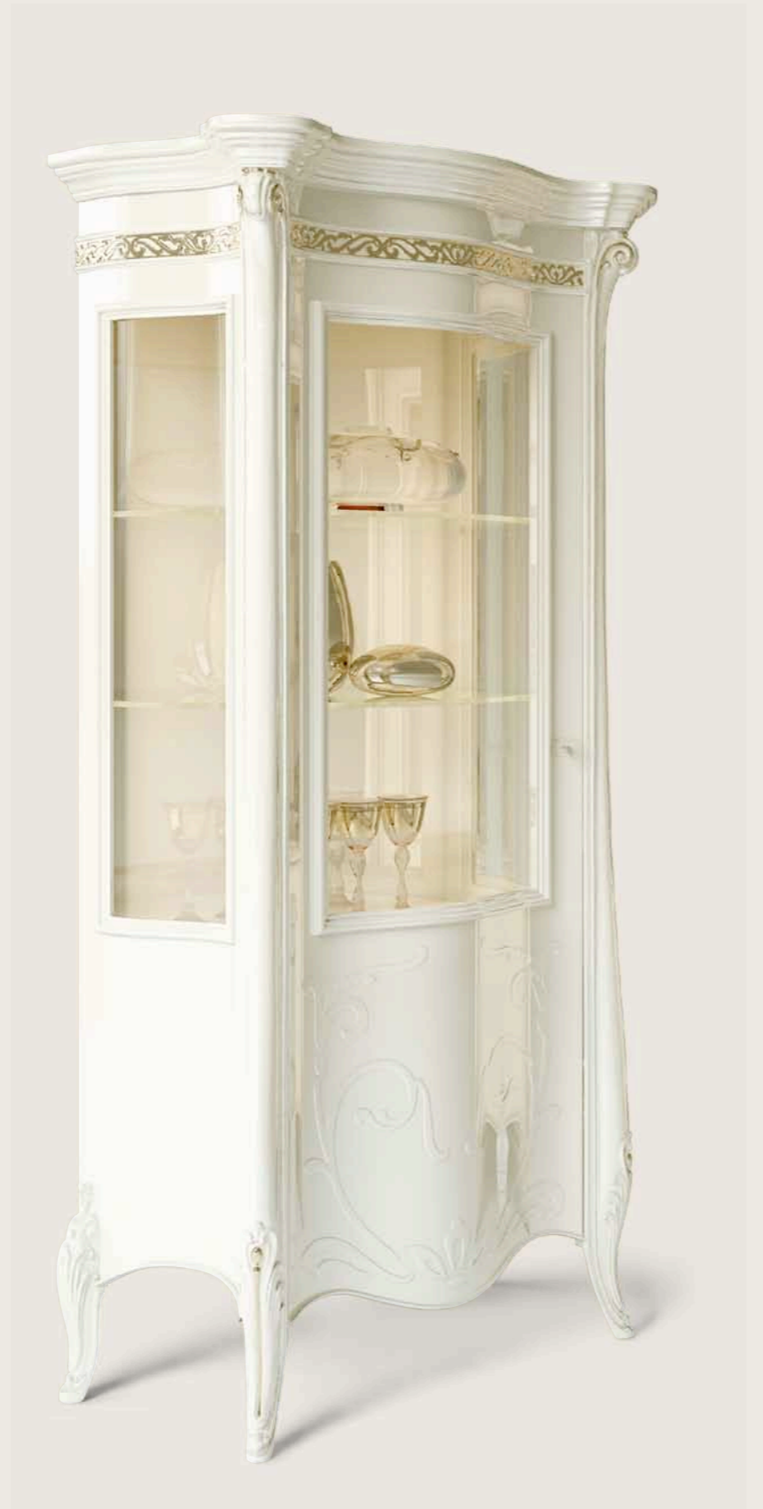
Art. E-909 Vetrina 1/P senza cimasa, smontabile. Versione dx e sx 1-door showcase, without cresting rail. Easily disassembled. Right and left version Cm. 96 x 56 x h. 208

The Princess collection offers showcases that are able to add your own personal ideas to a living area with a classic yet contemporary style. The common denominator of this furniture is the sophistication of the carvings and an unparalleled formal elegance.