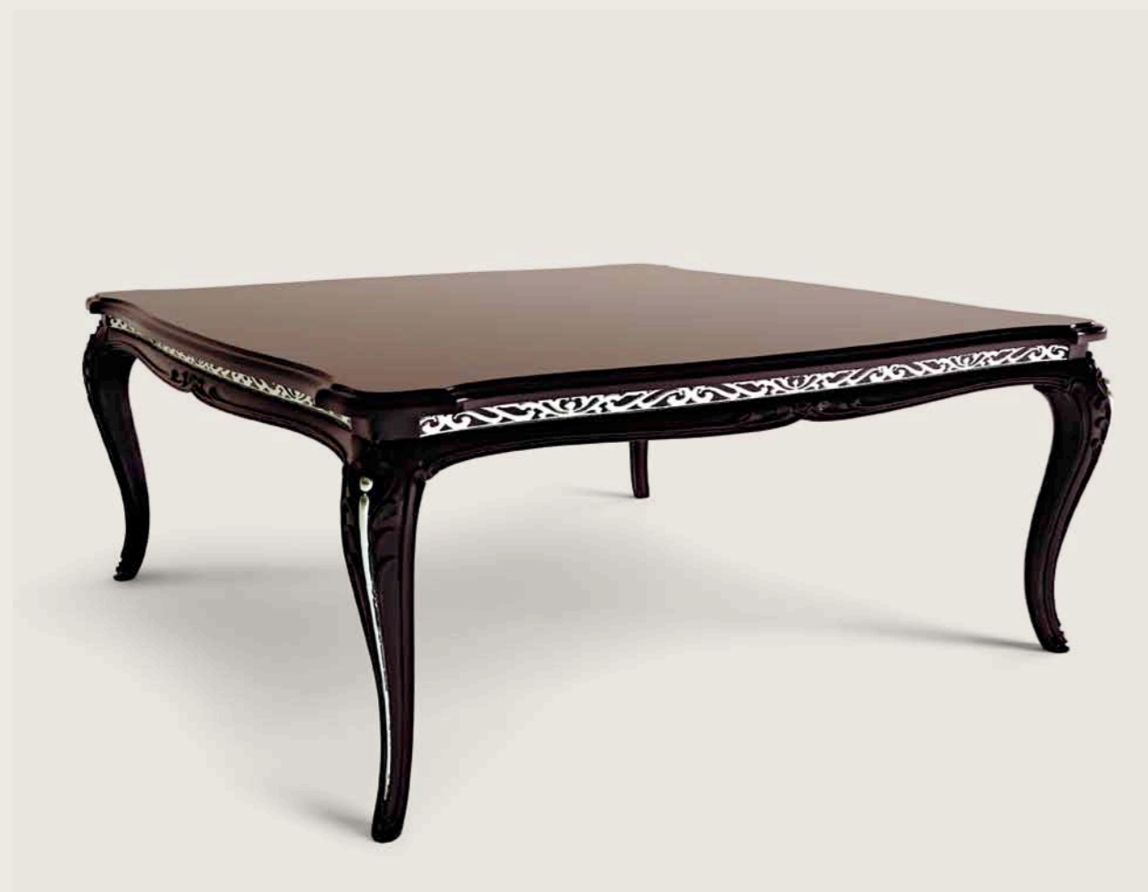
Art. E-913 Tavolino quadrato Square table Cm.112 x 112 x h. 48