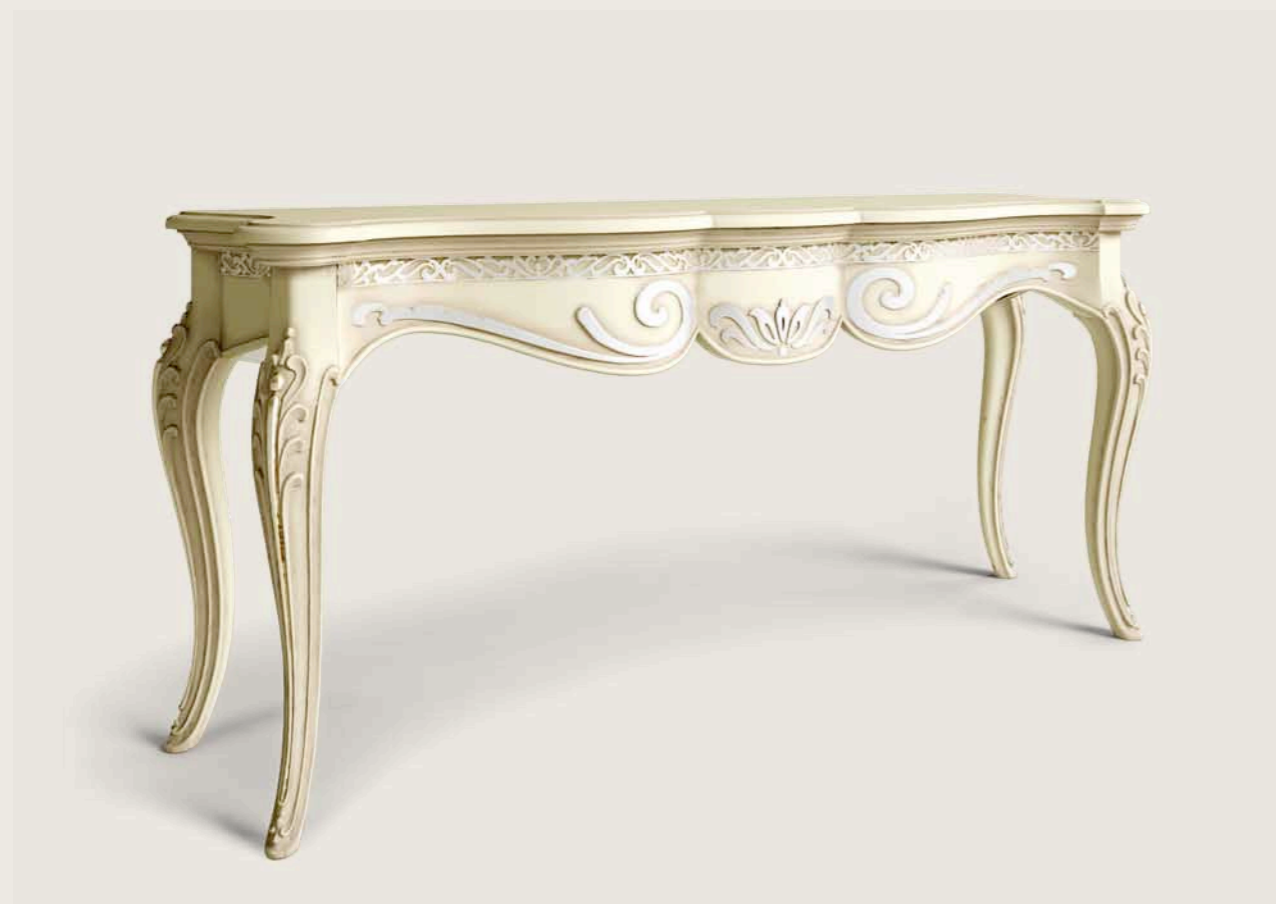
Art. E-912 Consolle con cassetto Console with drawer Cm. 175 x 40 x h. 85

Order and elegance – harmony with which you can now design that unrepeatably rhythm of our daily lives. This is a collection that arises from our love for tradition and style, where quality takes centre stage.