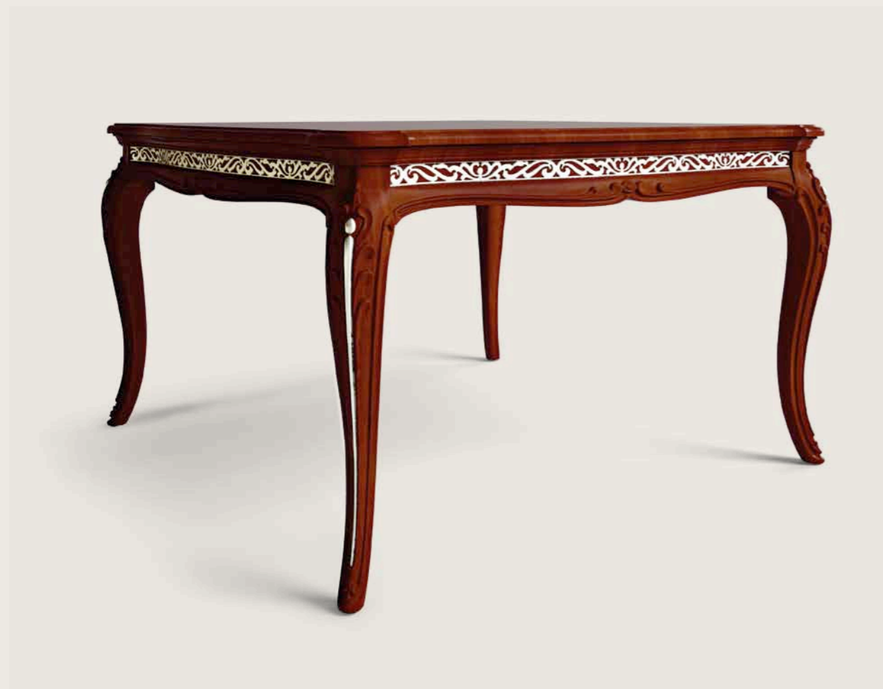
Art. E-903 Tavolo quadrato allungabile Extendible square table Cm. 130 x 130 x h. 79 (Cm. 185 x 130 aperto, open)

High artisan craftsmanship, a rare quality that arises from that balance between bygone artisan techniques and the contemporary style of our company – where quality is rediscovered in these unparalleled products.