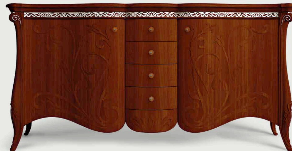
Art. E-902 Credenza 2/P, 4 cassetti, smontabile 2-door sideboard with 4 drawers. Easily disassembled. Cm. 222 x 59 x h. 112

The classic lines of the sideboard are enhanced by the artisan craftsmanship – elegance and style are the winning elements of today's abode.