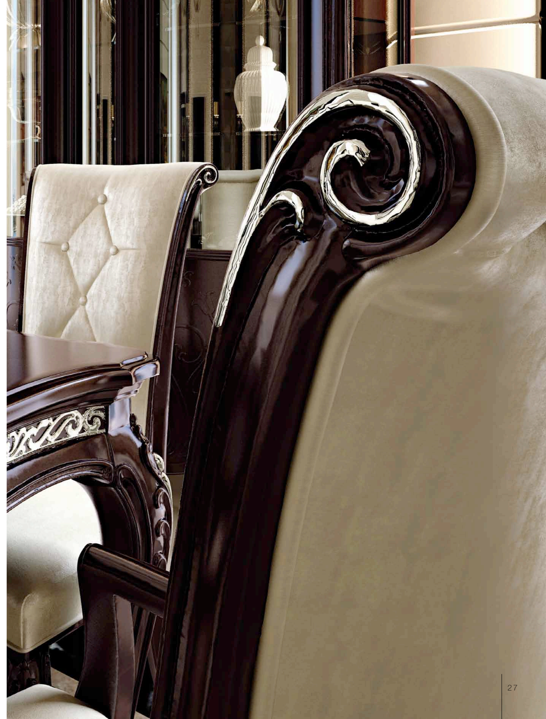
Art. E-908 Capotavola senza cimasa Head of the table, without cresting rail Cm. 57 x 63 x h. 106