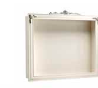
Art. 1011T Pensile Porta TV TV Framed Wall Cabinet 160 x 25 x 124H