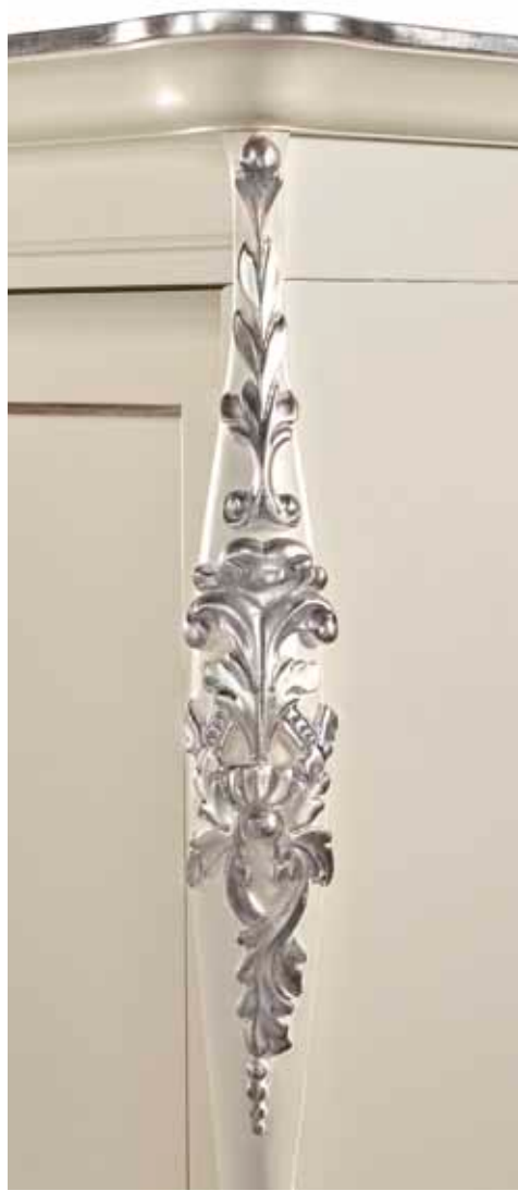
Burro + foglia argento