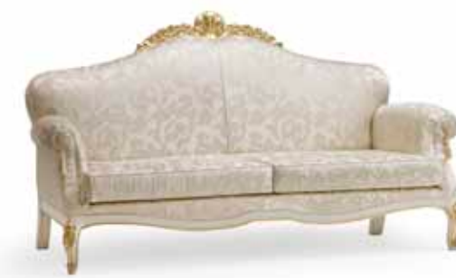
Art. 1068T Divano a tre posti Sofa 3 seats 225 x 97 x 125H