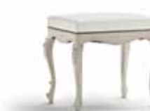
Art. 1039T Panchetta cm. 60 Bench 60 x 50 x 54H