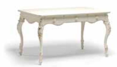
Art. 1021T Scrivania Desk 141 x 91 x 81H