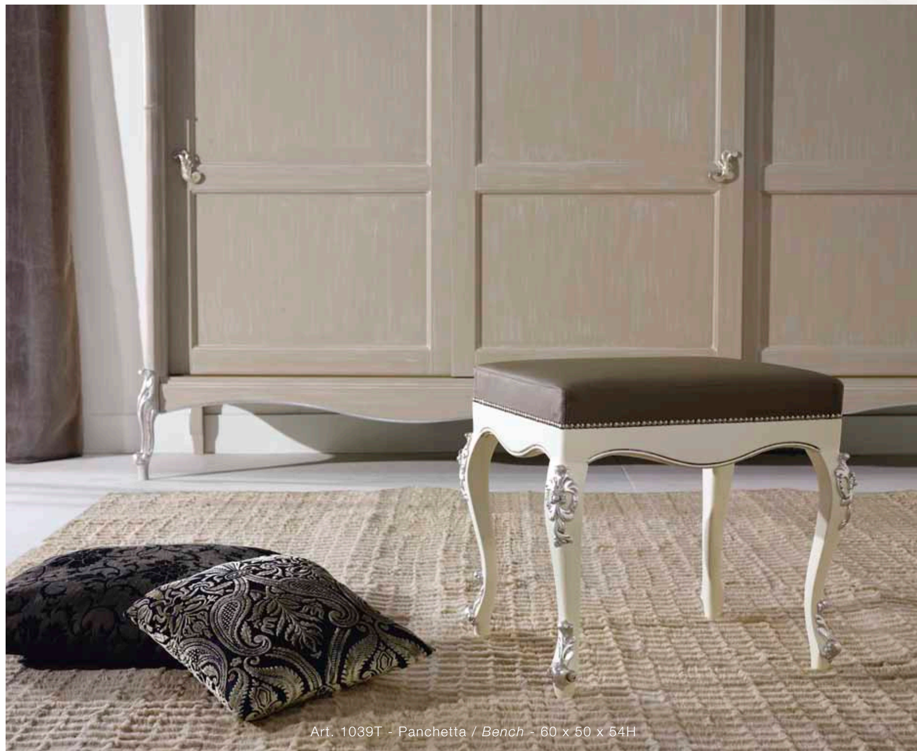
Art. 1039T - Panchetta / Bench - 60 x 50 x 54H