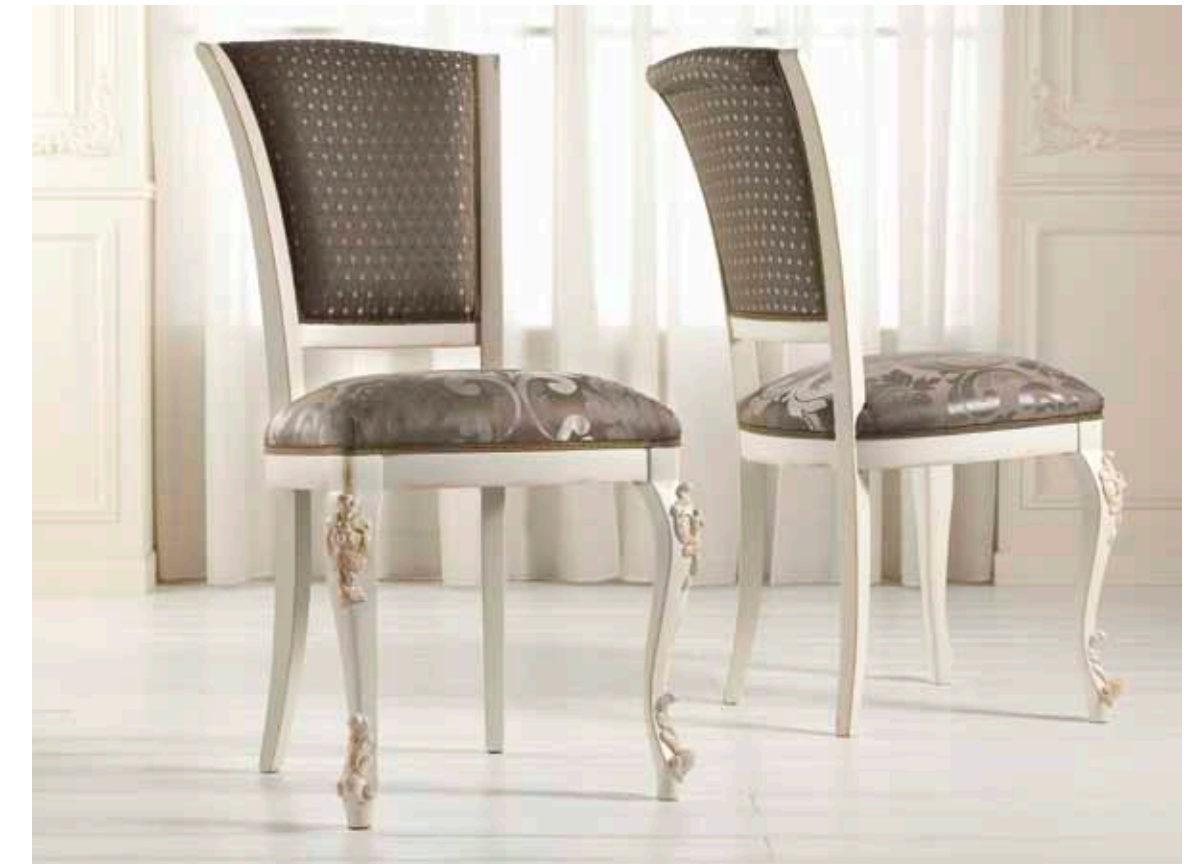
Art. 1004T - Sedia / Chair - 54 x 59 x 101H - tessuto / fabric "Rubino"