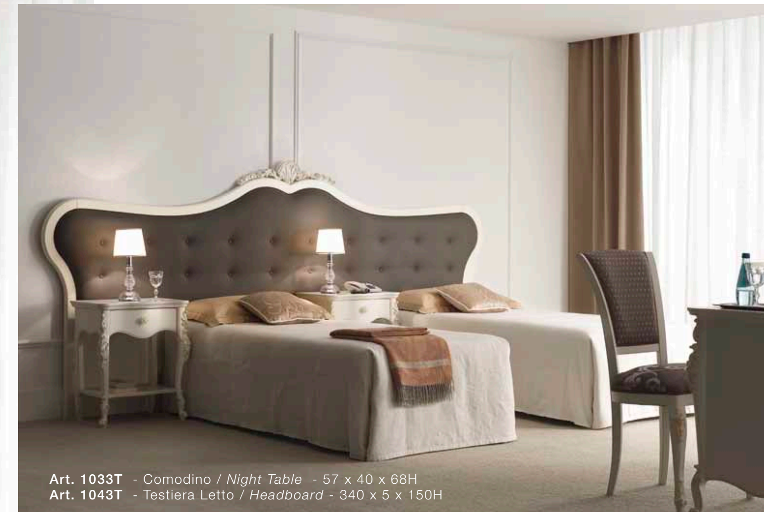
Art. 1033T - Comodino / Night Table - 57 x 40 x 68H Art. 1043T - Testiera Letto / Headboard - 340 x 5 x 150H

La testata capitonnè di grandi dimensioni studiata espressamente per il contract permette di avere la soluzione matrimoniale o quella a letti singoli.