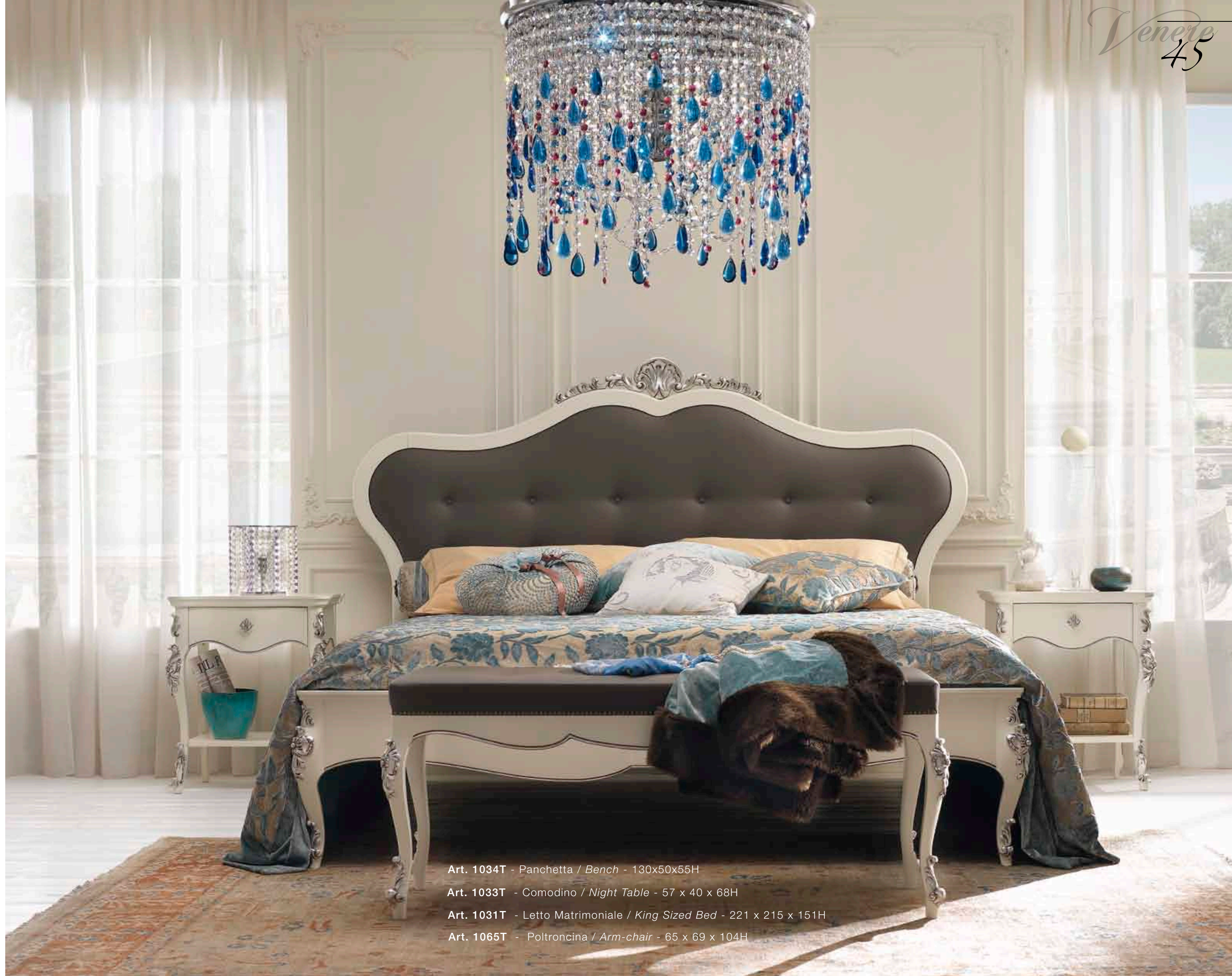
Art. 1034T - Panchetta / Bench - 130x50x55H