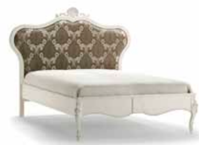
Art. 1040T Letto una piazza e mezza French Sized Double Bed 181 x 215 x 149H