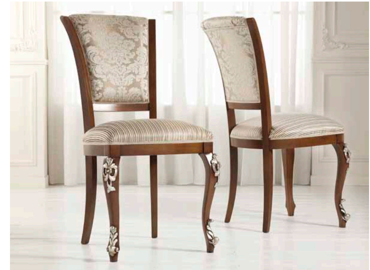
Art. 1004T - Sedia / Chair - 54 x 59 x 101H - tessuto / fabric "Vienna"