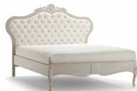
Art. 1038T Letto matrimoniale Bed 201 x 215 x 151H