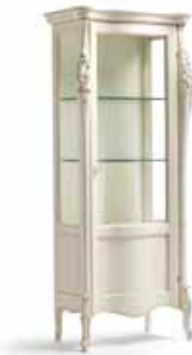
Art. 1008T Vetrina una porta destra One right door Display Cabinet 82 x 50 x 203H