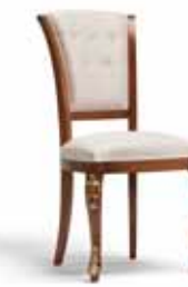
Art. 1004T Sedia Chair 54 x 59 x 101H tessuto "Siria" fabric "Siria"