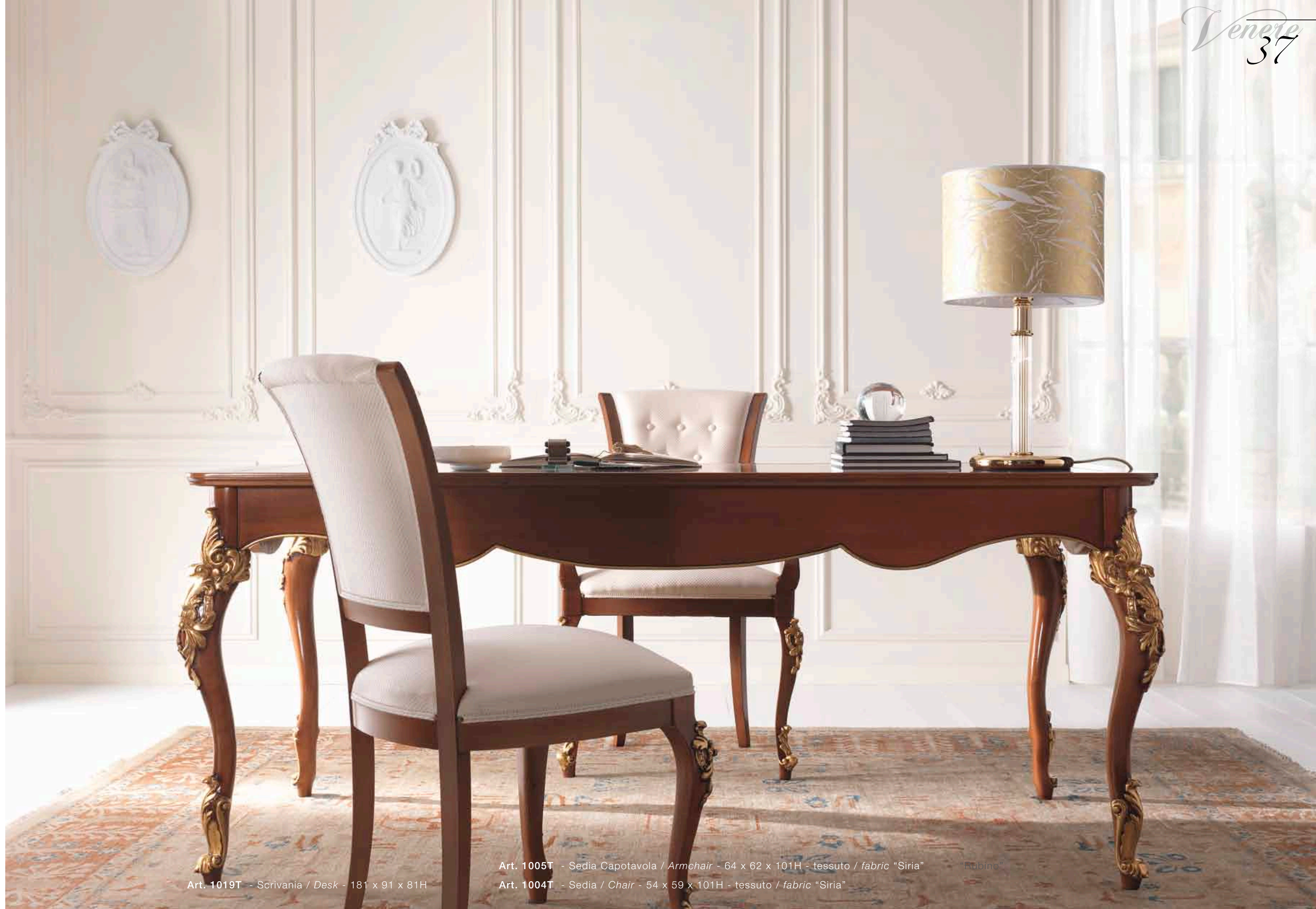
Art. 1019T - Scrivania / Desk - 181 x 91 x 81H

Practicality, functionality, tradition and history in the classic and elegant studio; and above all very current.