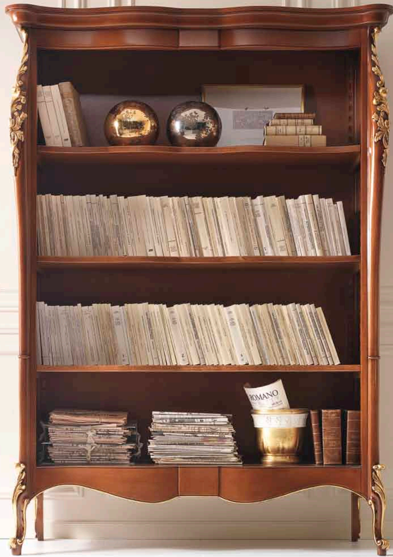
Art. 1018T - Libreria / Bookshelf - 145 x 50 x 203H