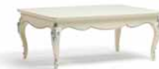
Art. 1022T Tavolino da salotto rettangolare Rectangular Coffee Table 120 x 80 x 48H