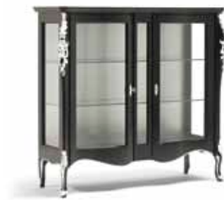
Art. 1012T Vetrinetta 2 porte 2 doors Display Cabinet 141 x 48 x 130H