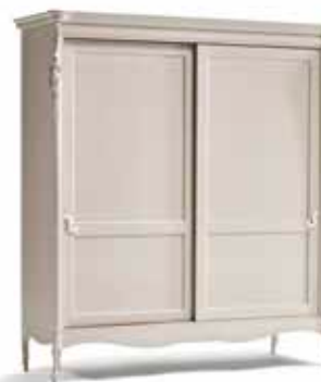
Art. 1037T Armadio 2 ante scorrevoli Sliding 2-Door Wardrobe 200 x 69 x 225H