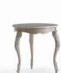
Art. 1069T Tavolino Coffee table cm.Ø 70 x 75H