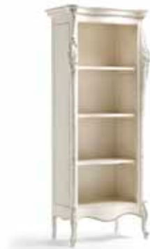
Art. 1020T Libreria Bookshelf 82 x 50 x 203H