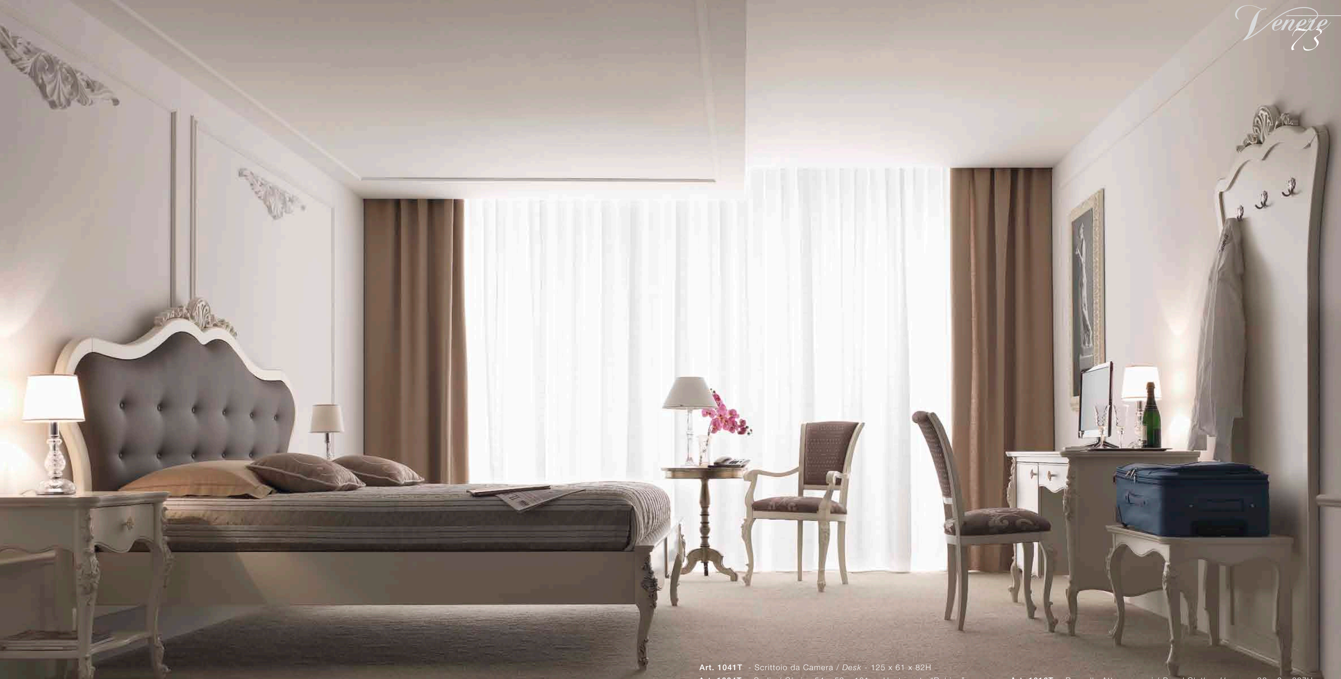
Art. 1033T - Comodino / Night Table - 57 x 40 x 68H