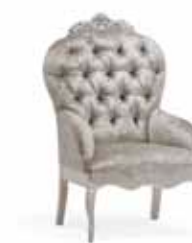
Art. 1065T Poltroncina Arm-chair 65 x 69 x 104H