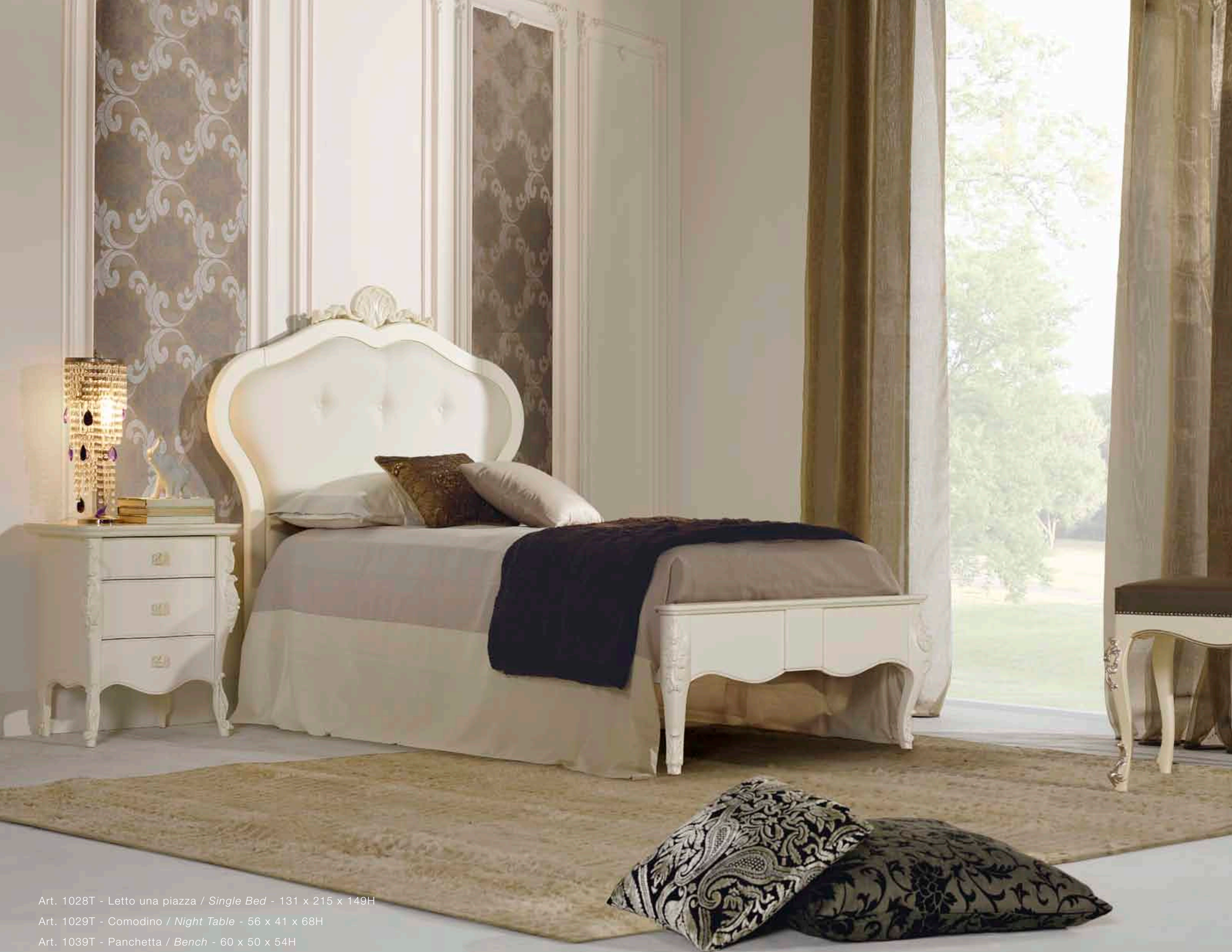
Art. 1028T - Letto una piazza / Single Bed - 131 x 215 x 149H