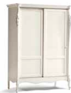
Art. 1042T Armadietto 2 ante scorrevoli Sliding 2-Door small Wardrobe 148 x 67 x 204H