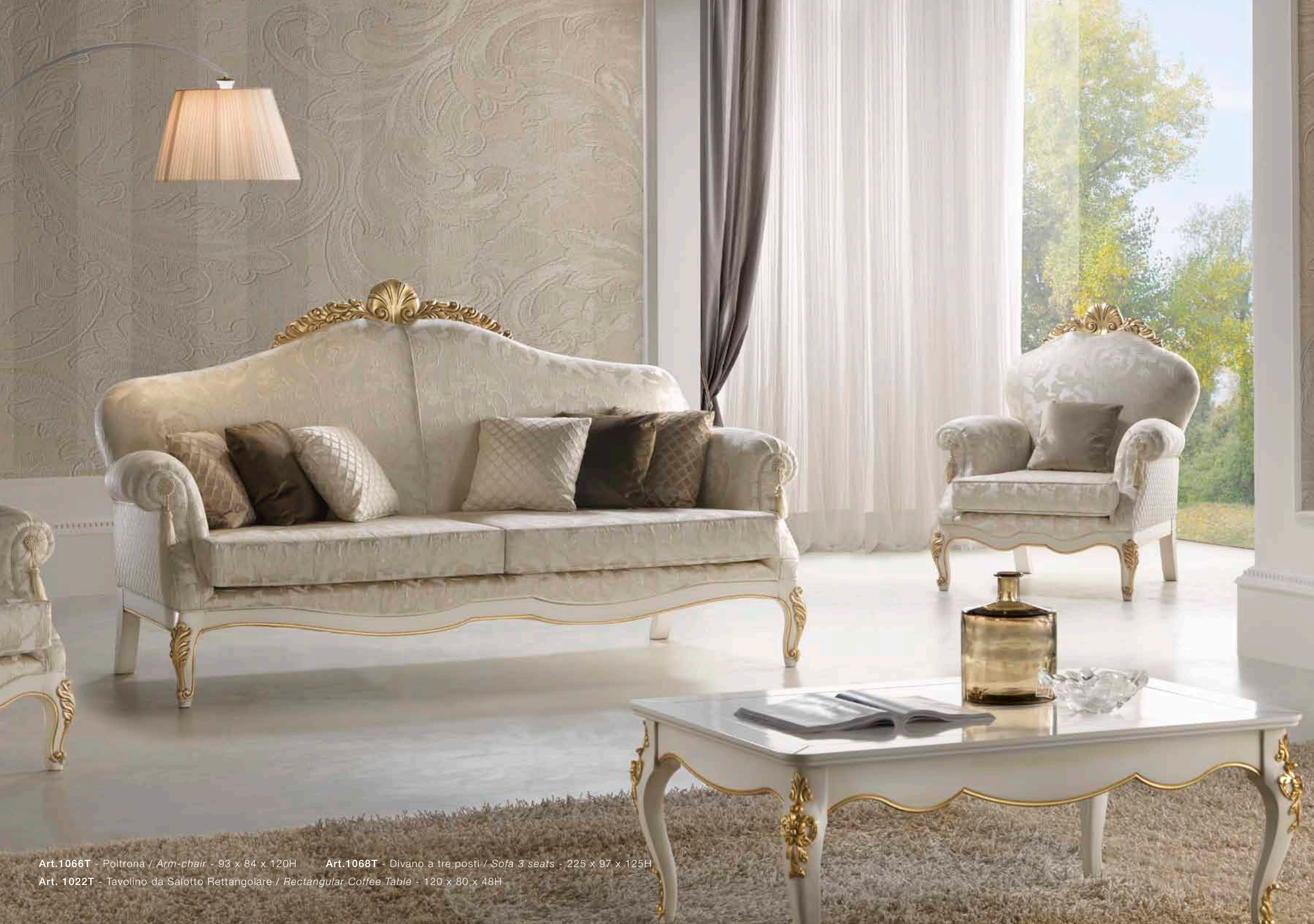
Art.1066T - Poltrona / Arm-chair - 93 x 84 x 120H Art.1068T - Divano a tre posti / Sofa 3 seats - 225 x 97 x 125H