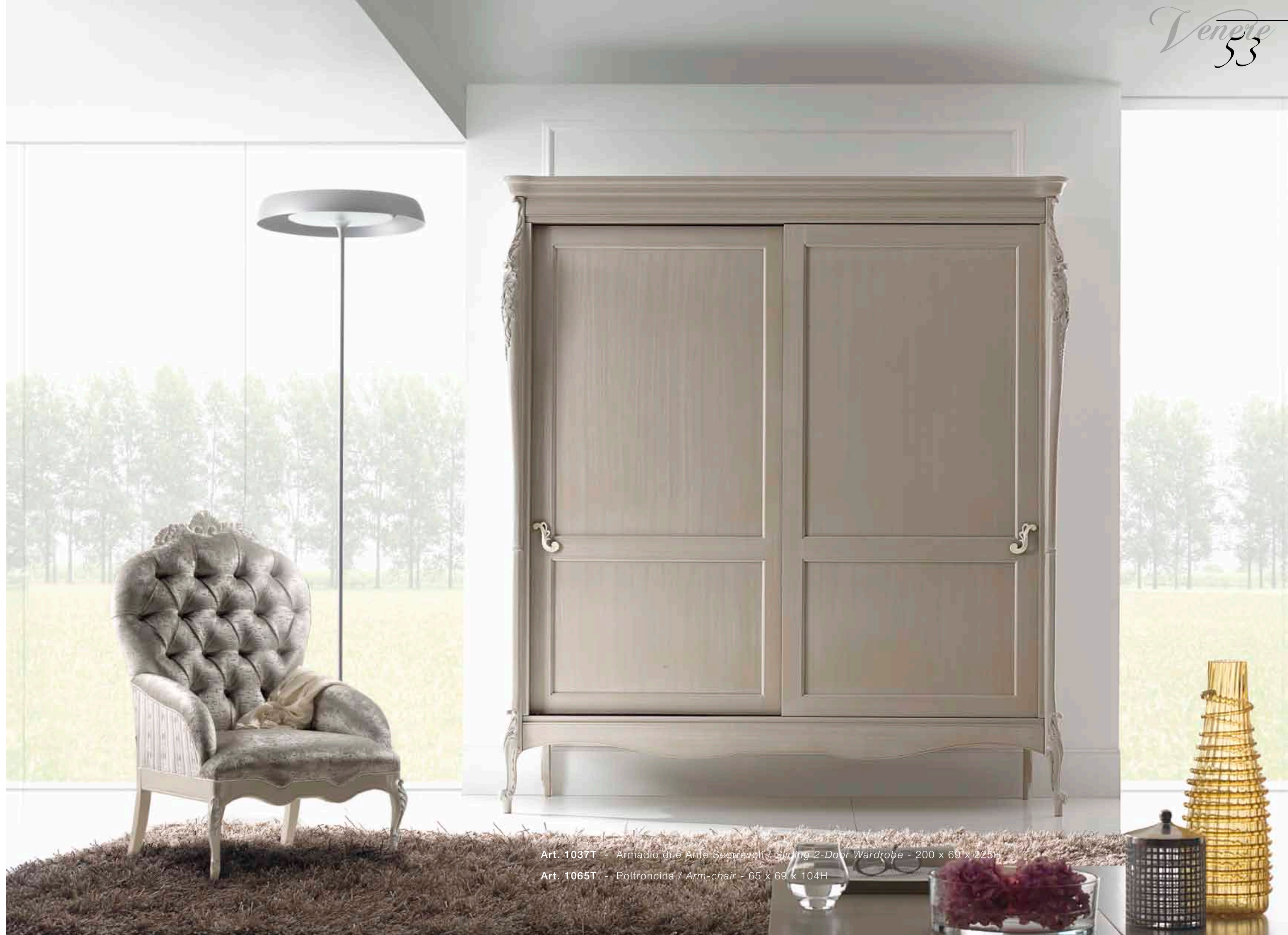
Art. 1037T - Armadio due Ante Scorrivoli - Sliding 2-Door Wardrobe - 200 x 69 x 225H