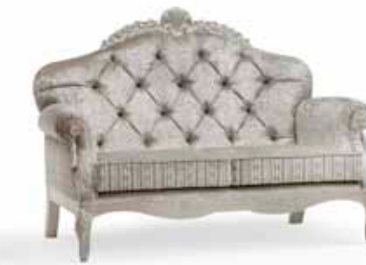
Art. 1067T Divano a due posti Sofa 2 seats 173 x 94 x 125H