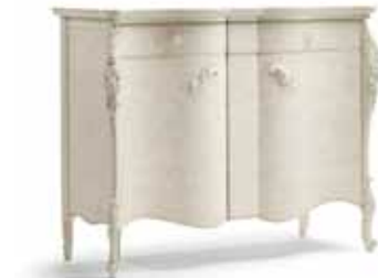
Art. 1006T Credenza Sideboard 137 x 57 x 110H