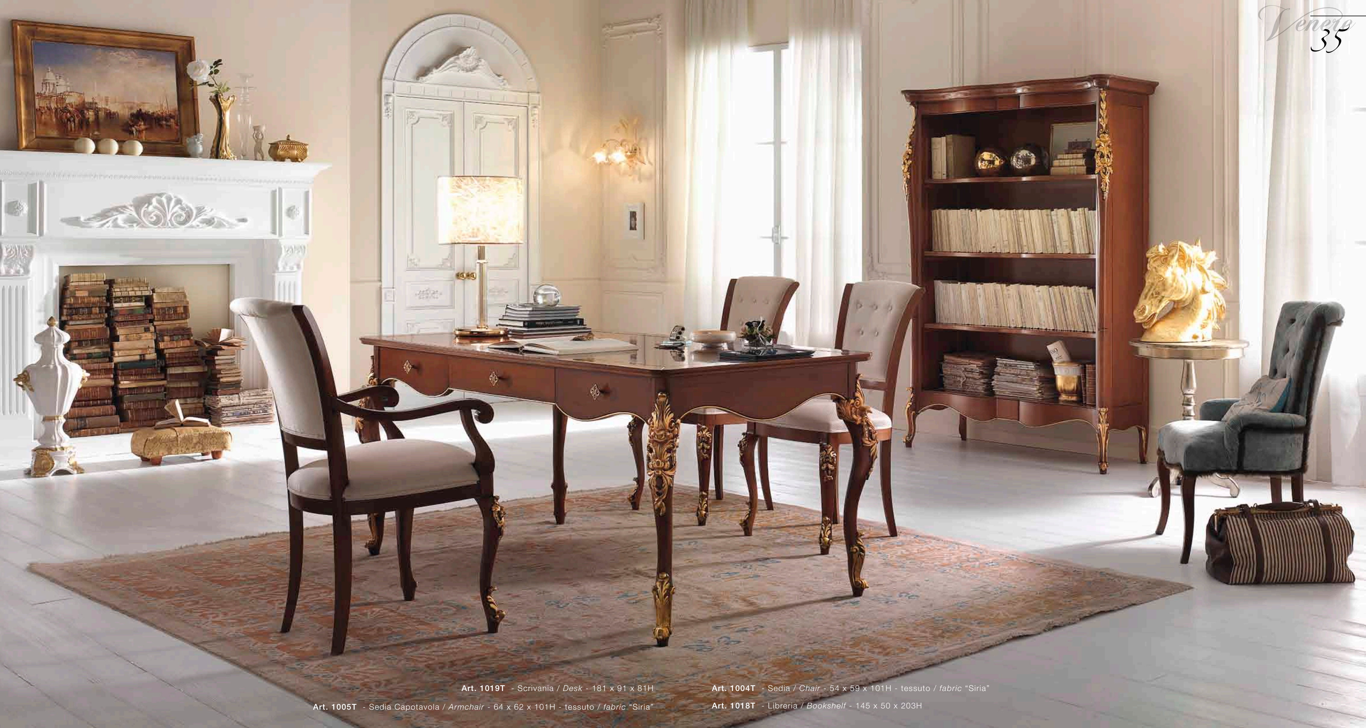
Art. 1019T - Scrivania / Desk - 181 x 91 x 81H