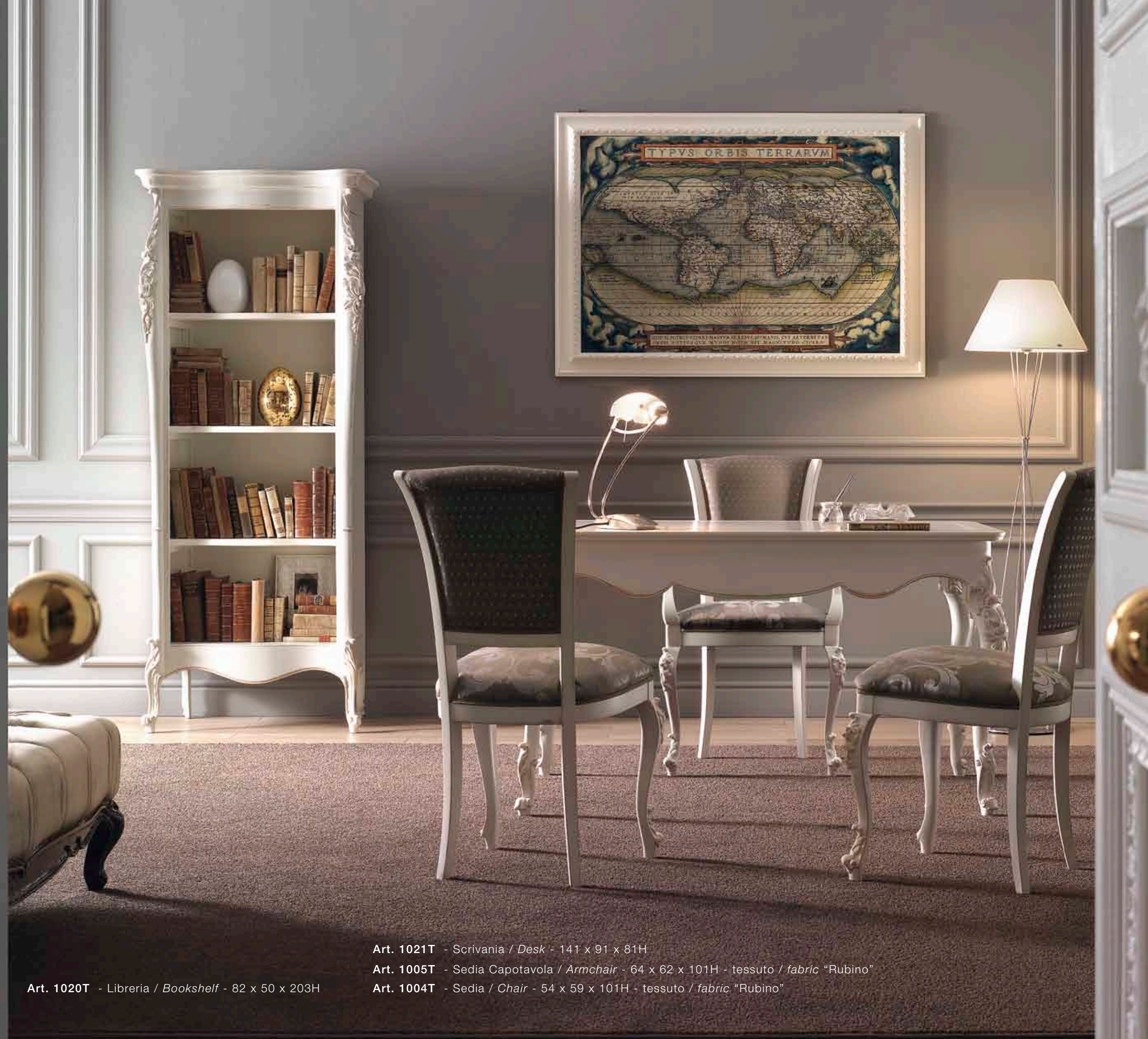
Art. 1021T - Scrivania / Desk - 141 x 91 x 81H