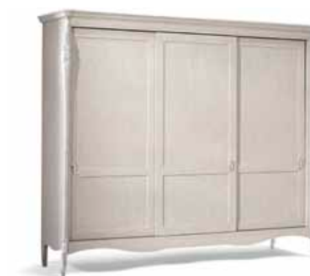
Art. 1030T Armadio tre Ante Scorrevoli Sliding 3-Door Wardrobe 300 x 69 x 250H