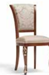
Art. 1004T Sedia Chair 54 x 59 x 101H tessuto "Vienna" fabric "Vienna"