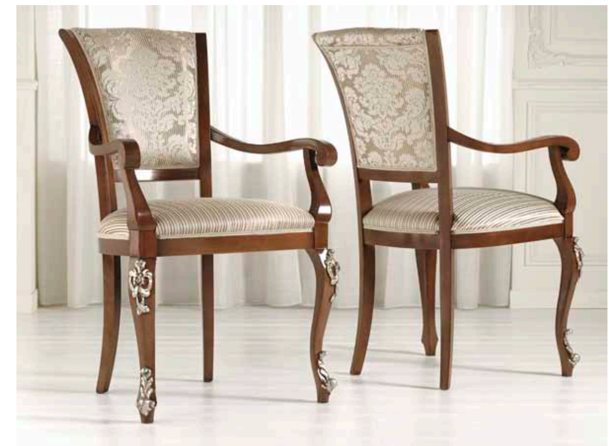
Art. 1005T - Sedia capotavola / Armchair - 64 x 62 x 101H - tessuto / fabric "Vienna"