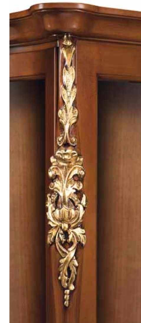
Noce + foglia oro