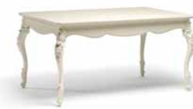
Art. 1007T Tavolo con 2 allunghe da cm. 39 Table with 2 extensions cm. 39 161 x 101 x 81H