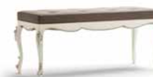
Art. 1034T Panchetta cm. 130 Bench 130 x 50 x 55H