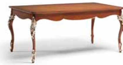
Art. 1003T Tavolo con 2 allunghe da cm. 39 Table with 2 extensions cm. 39 201 x 101 x 81H