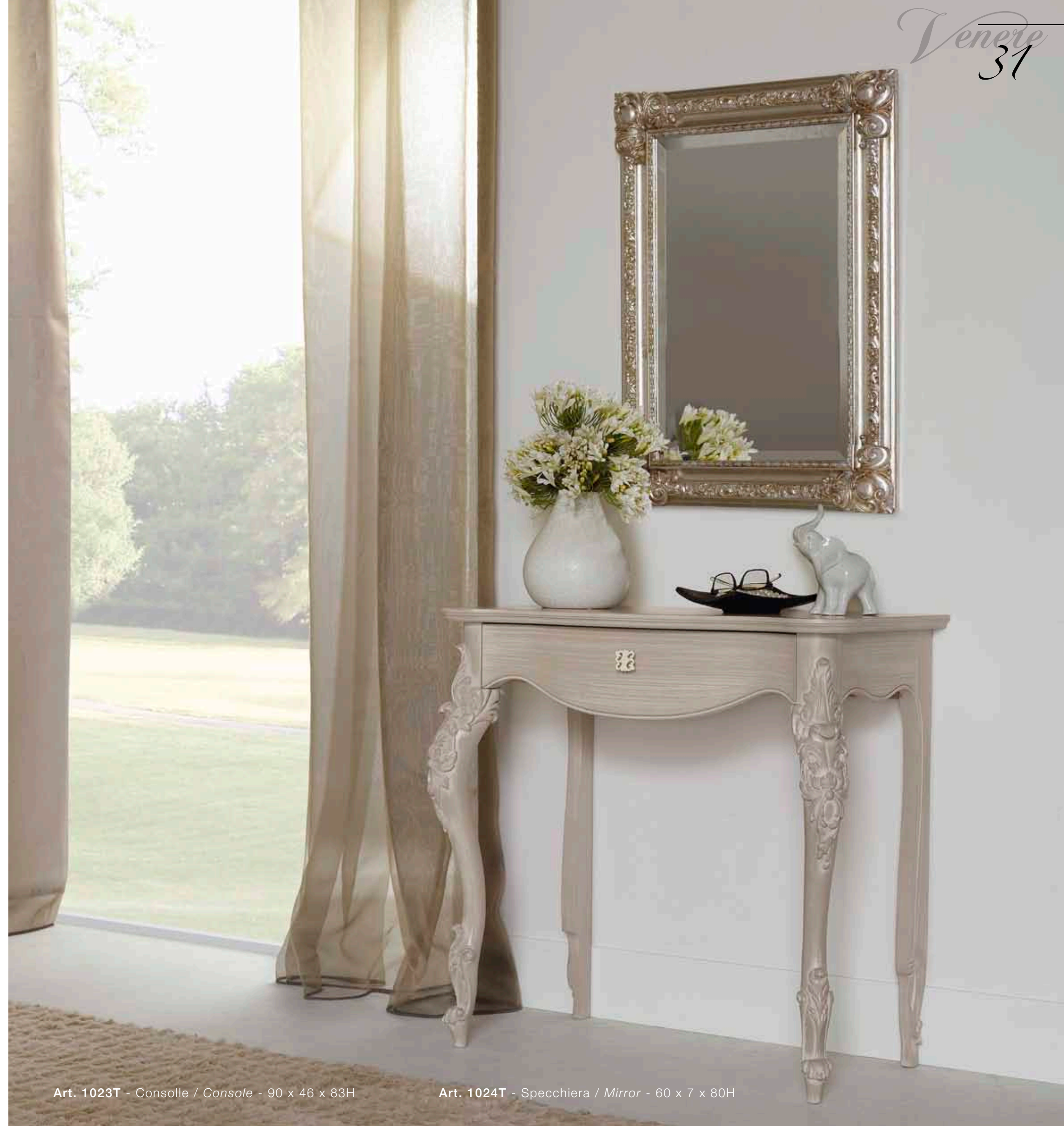
Art. 1023T - Consolle / Console - 90 x 46 x 83H