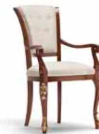
Art. 1005T Sedia Capotavola Armchair 64 x 62 x 101H tessuto "Siria" fabric "Siria"