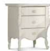
Art. 1029T Comodino Night Table 56 x 41 x 68H