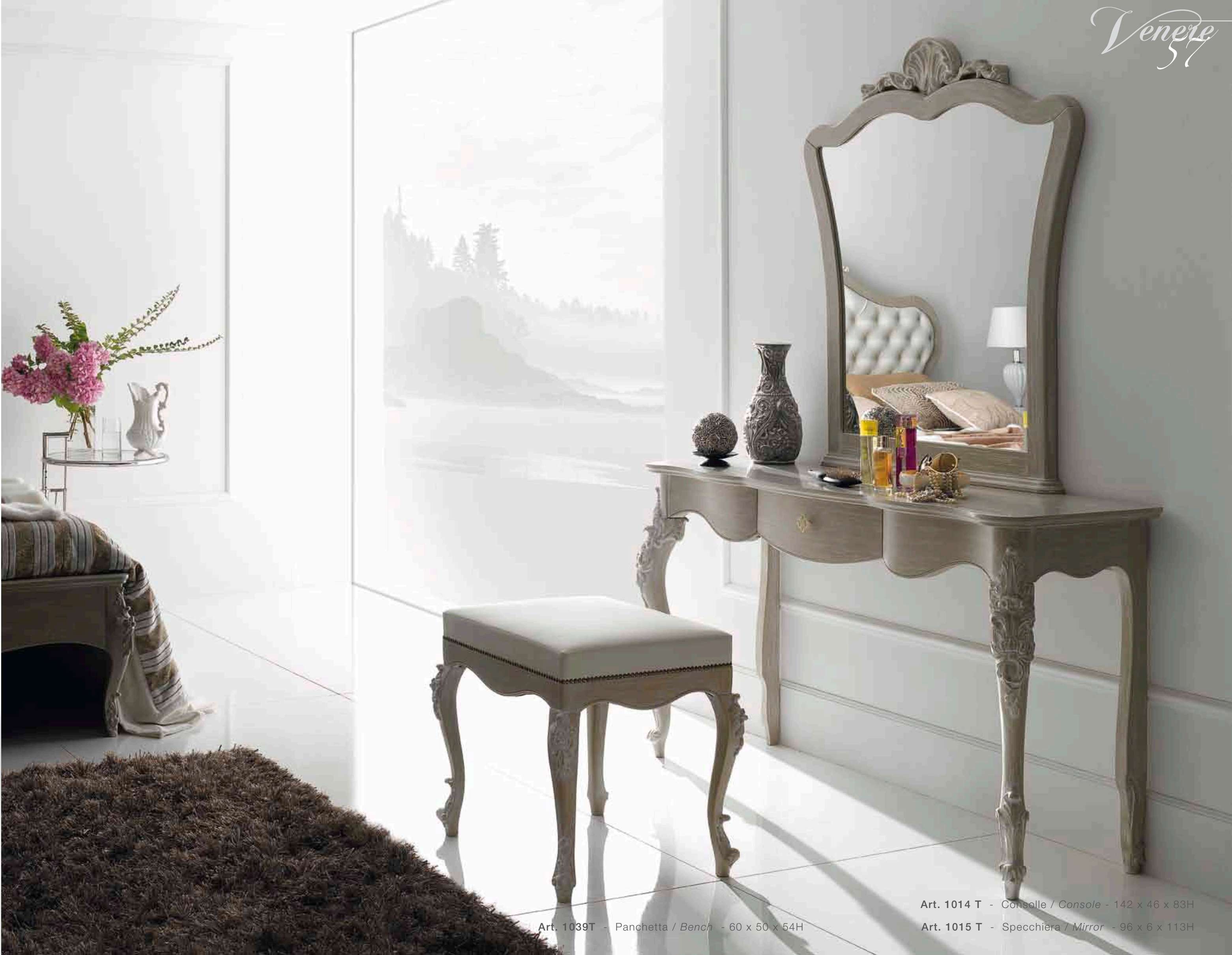
Art. 1039T - Panchetta / Bench - 60 x 50 x 54H