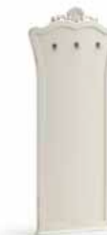
Art. 1016T Pannello da ingresso Panel Hanger 96 x 6 x 207H