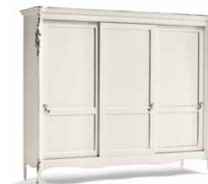
Art. 1035T Armadio 3 ante scorrevoli Sliding 3-Door Wardrobe 260 x 69 x 225H