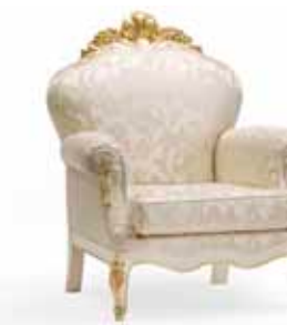
Art. 1066T Poltrona Arm-chair 93 x 84 x 120H