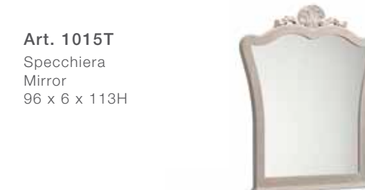
Art. 1015T Specchiera Mirror 96 x 6 x 113H