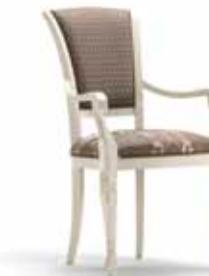
Art. 1005T Sedia Capotavola Armchair 64 x 62 x 101H tessuto "Rubino" fabric "Rubino"