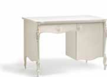
Art. 1045T Scrittoio da camera Bedroom Desk 125 x 61 x 82H