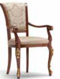
Art. 1005T Sedia Capotavola Armchair 64 x 62 x 101H tessuto "Vienna" fabric "Vienna"