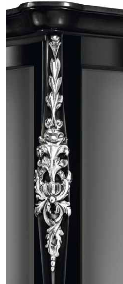
Nero + foglia argento