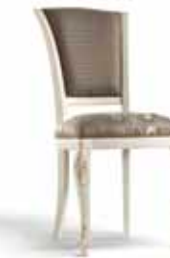
Art. 1004T Sedia Chair 54 x 59 x 101H tessuto "Rubino" fabric "Rubino"