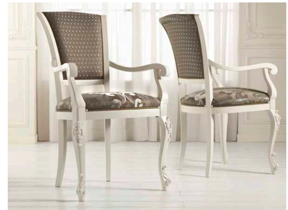
Art. 1005T - Sedia capotavola / Armchair - 64 x 62 x 101H - tessuto / fabric "Rubino"