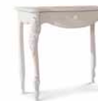
Art. 1023T Consolle Console 90 x 46 x 83H