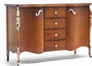
Art. 1001T Credenza Sideboard 170 x 57 x 110H