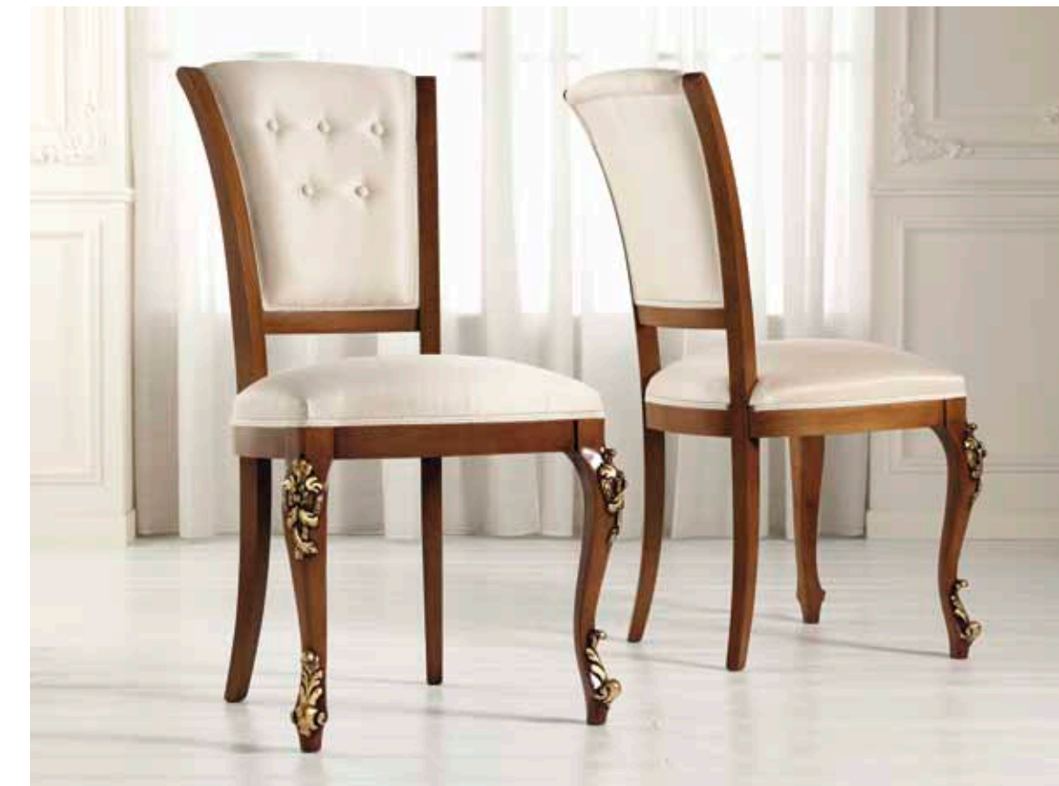
Art. 1004T - Sedia / Chair - 54x59x101H - tessuto / fabric "Siria"