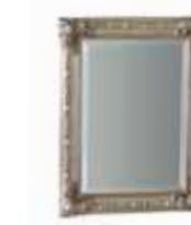
Art. 1024T Specchiera Mirror 60 x 7 x 80H