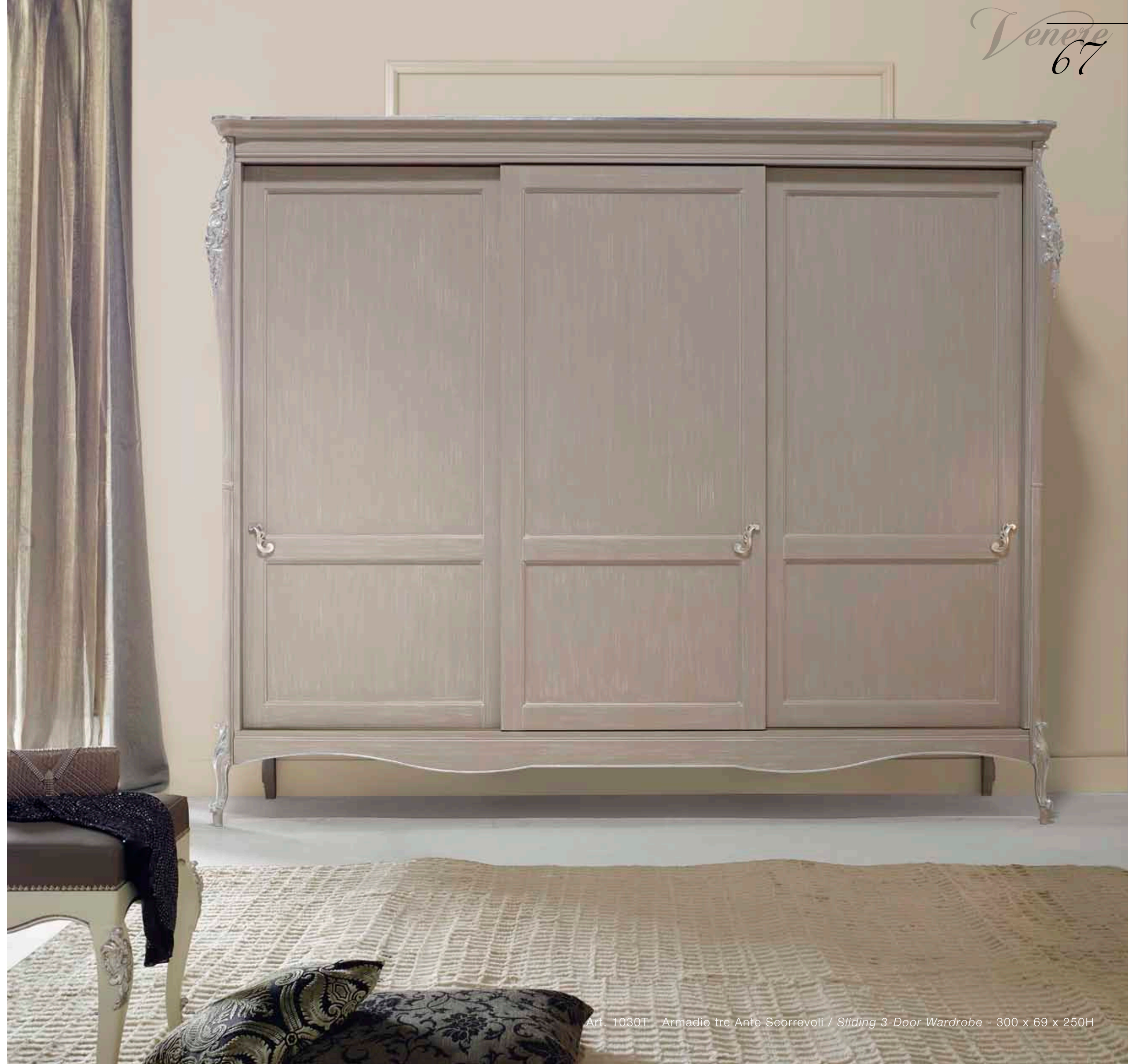
Art. 1030T - Armadio tre Ante Scorrevoli / Sliding 3-Door Wardrobe - 300 x 69 x 250H