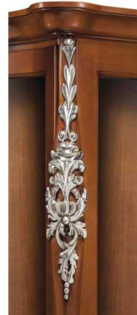
Noce + foglia argento