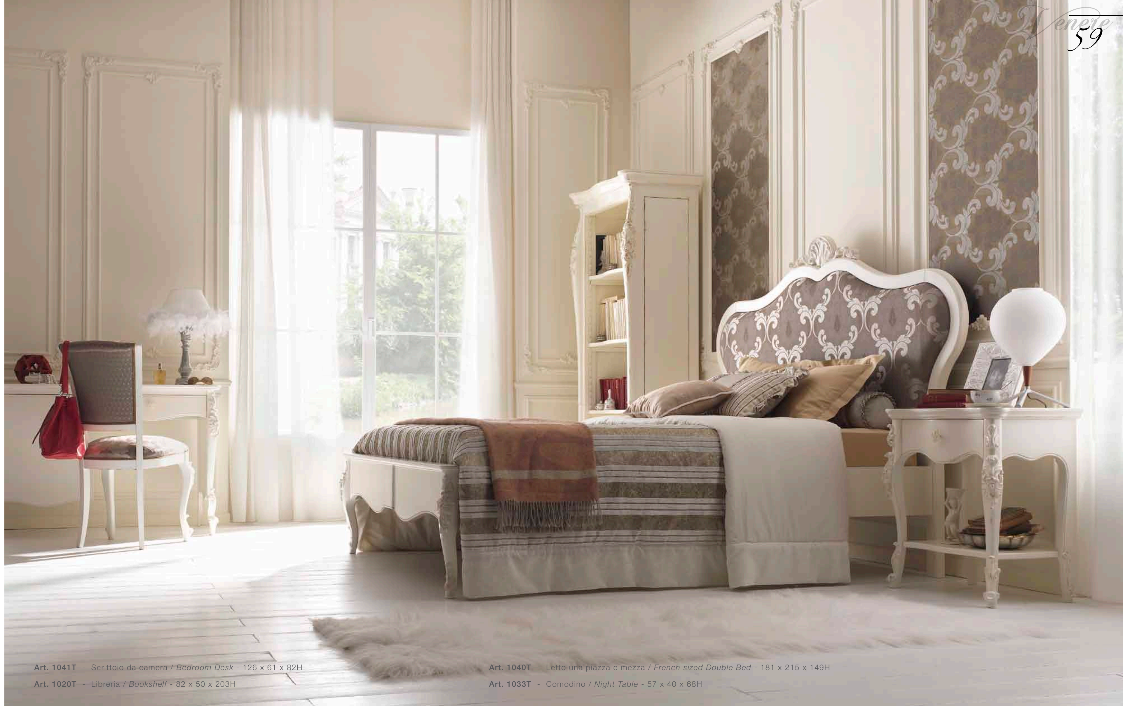
Art. 1041T - Scrivania da camera / Bedroom Desk - 126 x 61 x 82H

In the single room, the corner studio, with a small but functional desk equipped with side cabinet with one door compartment and a drawer.