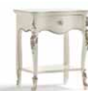
Art. 1033T Comodino Night Table 57 x 40 x 68H