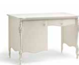
Art. 1041T Scrittoio da camera Bedroom Desk 125 x 61 x 82H