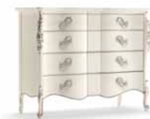
Art. 1032T Comò Chest of Drawers 137 x 57 x 110H