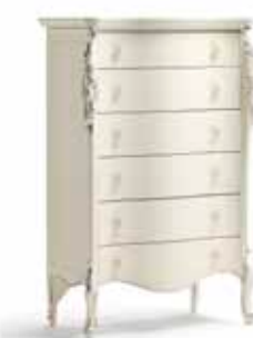
Art. 1036T Cassettiera Chest of Drawers 86 x 47 x 132H