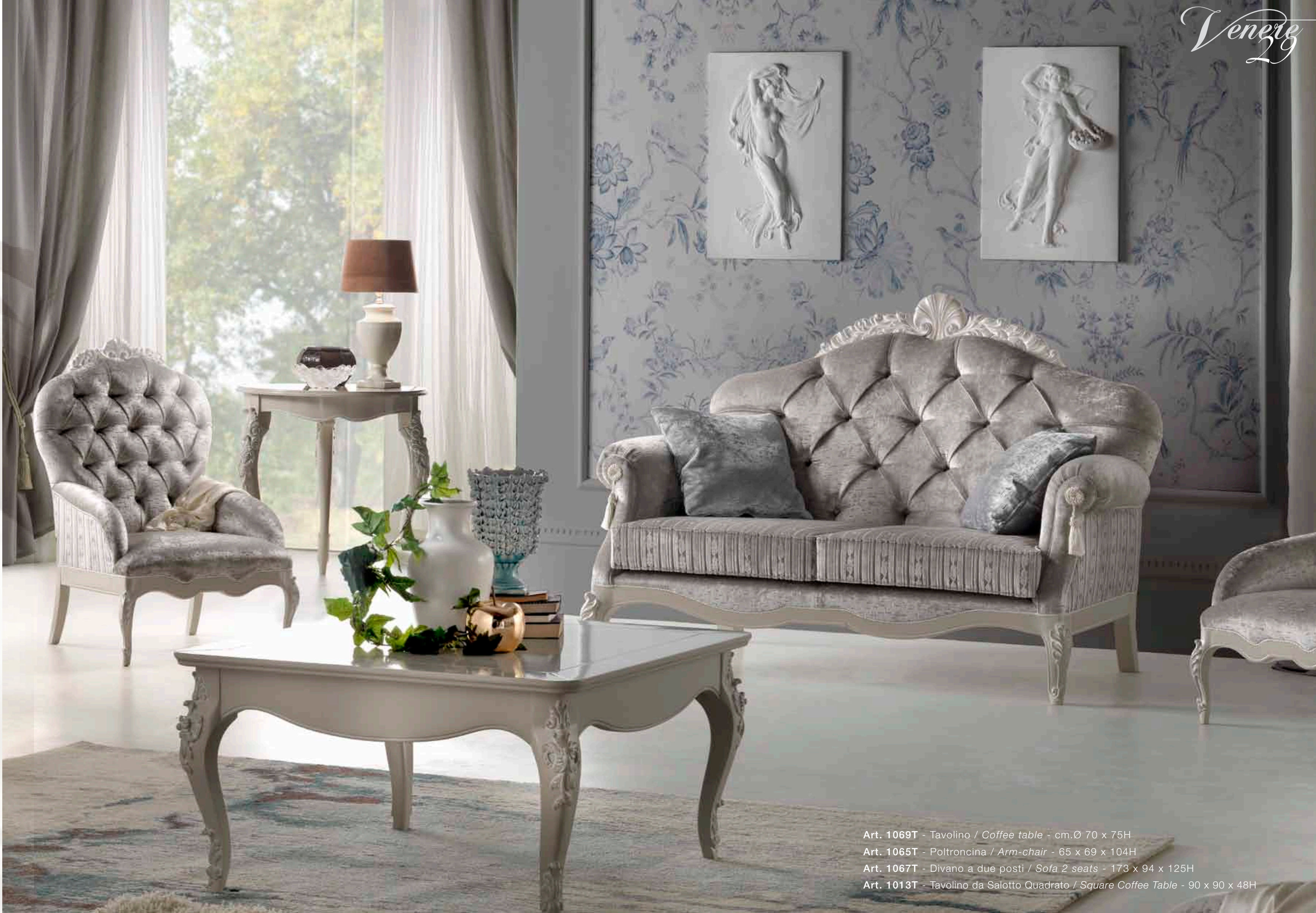
Art. 1069T - Tavolino / Coffee table - cm.Ø 70 x 75H Art. 1065T - Poltroncina / Arm-chair - 65 x 69 x 104H Art. 1067T - Divano a due posti / Sofa 2 seats - 173 x 94 x 125H Art. 1013T - Tavolino da Salotto Quadrato / Square Coffee Table - 90 x 90 x 48H