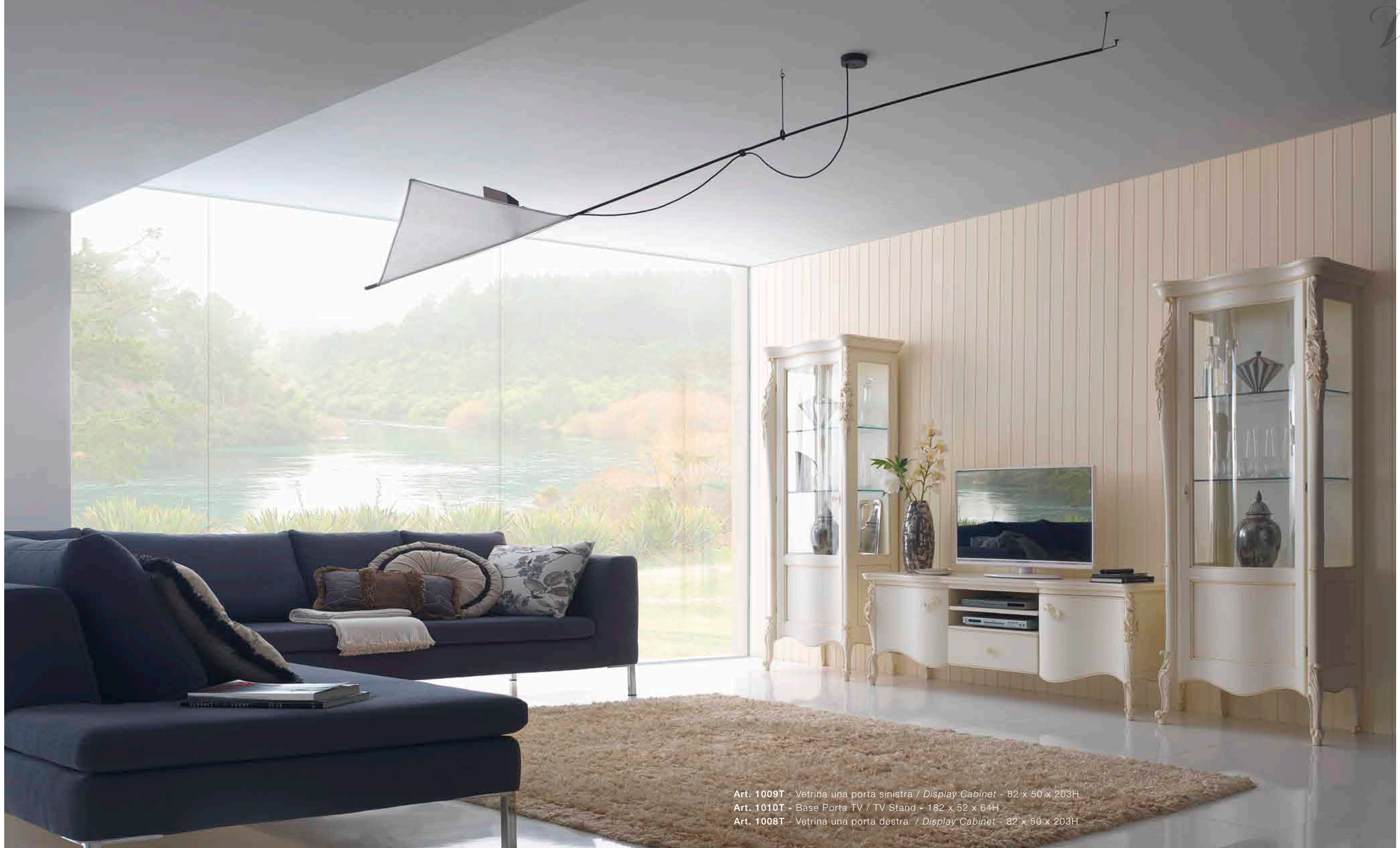
Art. 1009T - Vetrina una porta sinistra / Display Cabinet - 82 x 50 x 203H Art. 1010T - Base Porta TV / TV Stand - 182 x 52 x 64H Art. 1008T - Vetrina una porta destra / Display Cabinet - 82 x 50 x 203H