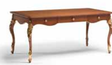
Art. 1019T Scrivania Desk 181 x 91 x 81H