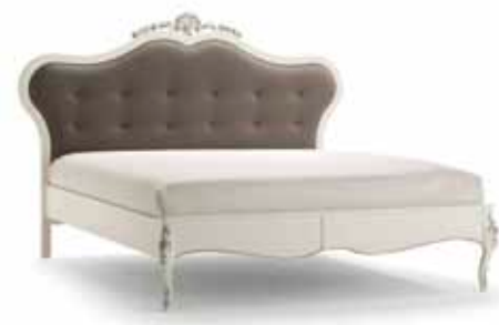
Art. 1031T Letto matrimoniale King Sized Bed 221 x 215 x 151H