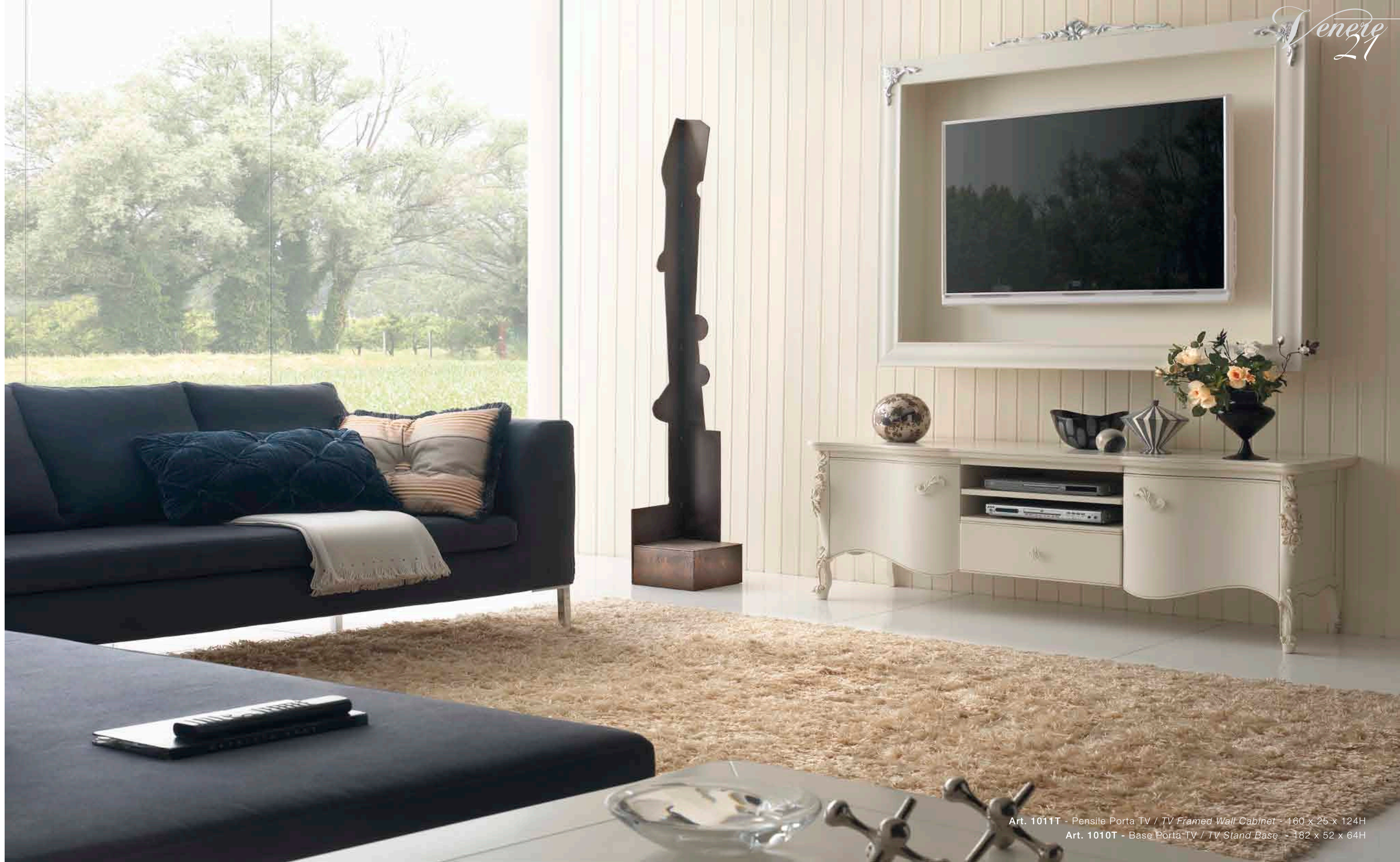
Art. 1011T - Pensile Porta TV / TV Framed Wall Cabinet - 160 x 25 x 124H Art. 1010T - Base Porta TV / TV Stand Base - 182 x 52 x 64H