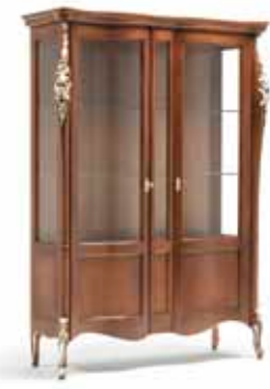
Art. 1002T Vetrina 2 porte 2 doors Display Cabinet 145 x 50 x 203H