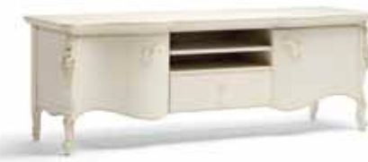
Art. 1010T Porta TV TV Stand Base 182 x 52 x 64H