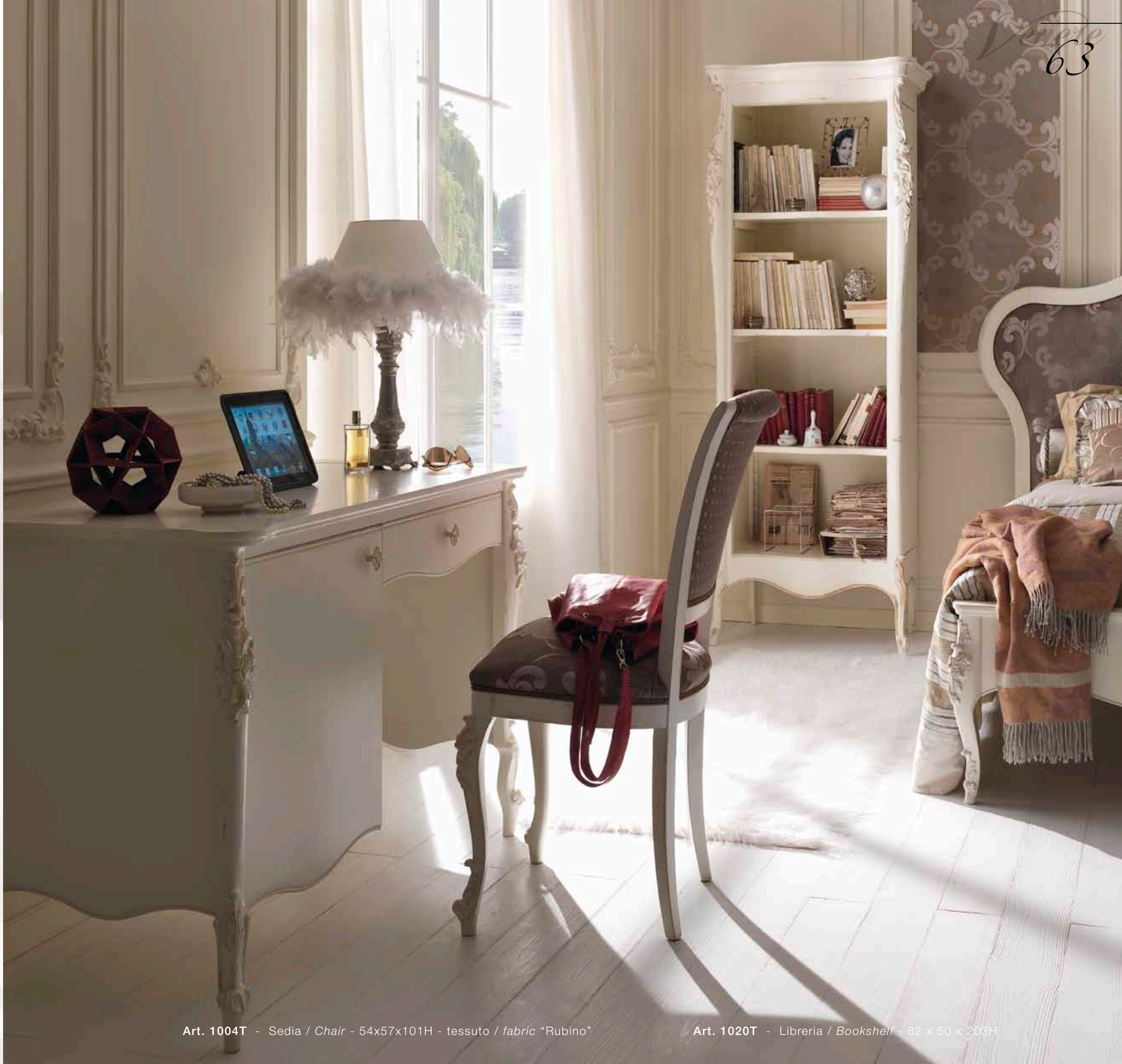
Art. 1004T - Sedia / Chair - 54x57x101H - tessuto / fabric "Rubino"