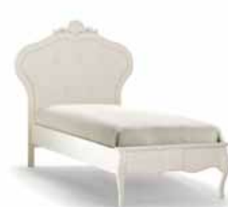
Art. 1028T Letto una piazza Single Bed 131 x 215 x 149H