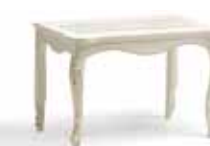
Art. 1044T Porta valigie Luggage Rest 78 x 47 x 51H