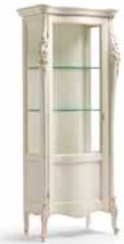
Art. 1009T Vetrina una porta sinistra One left door Display Cabinet 82 x 50 x 203H