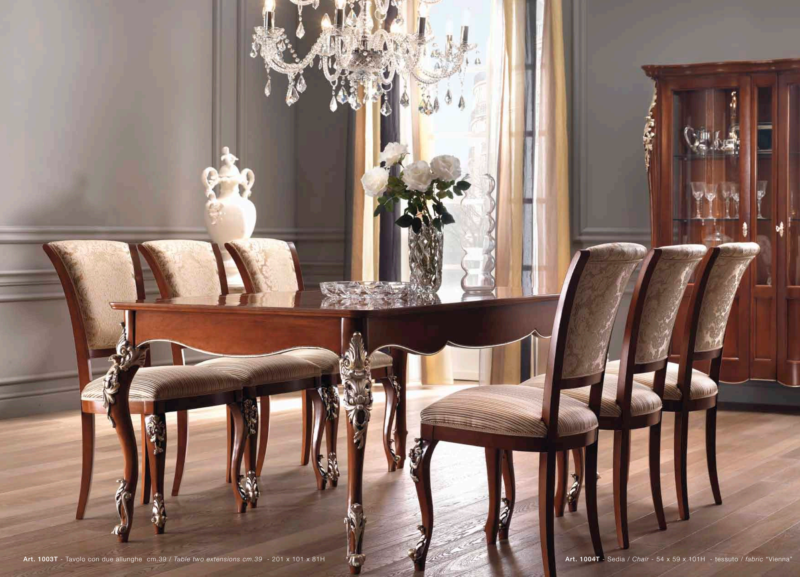
Art. 1003T - Tavolo con due allunghe cm.39 / Table two extensions cm.39 - 201 x 101 x 81H