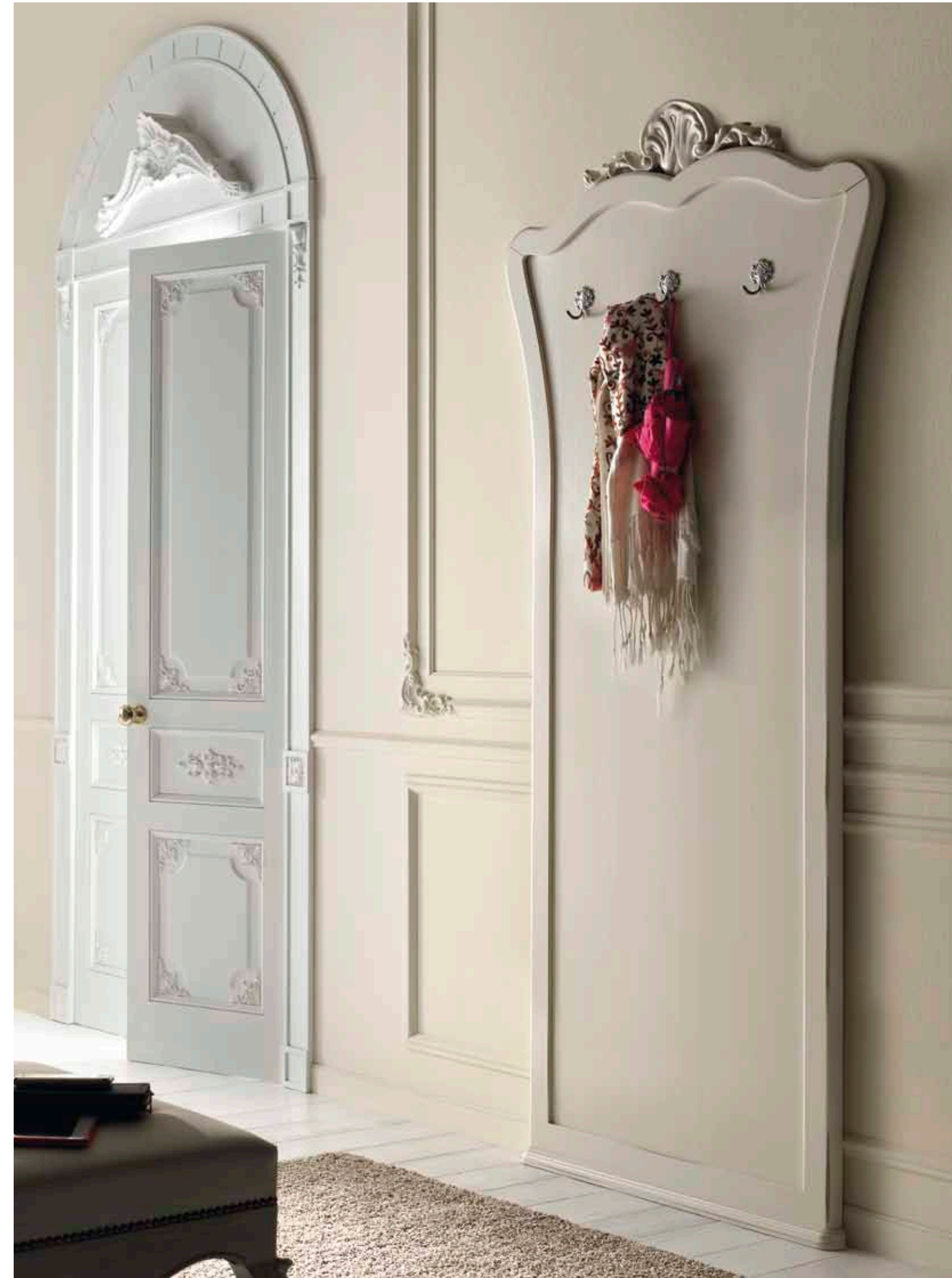
Art. 1016T - Pannello da ingresso / Clothes Hanger Panel - 96 x 6 x 207H