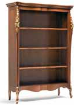
Art. 1018T Libreria Bookshelf 145 x 50 x 203H