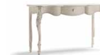
Art. 1014T Consolle Console 142 x 46 x 83H