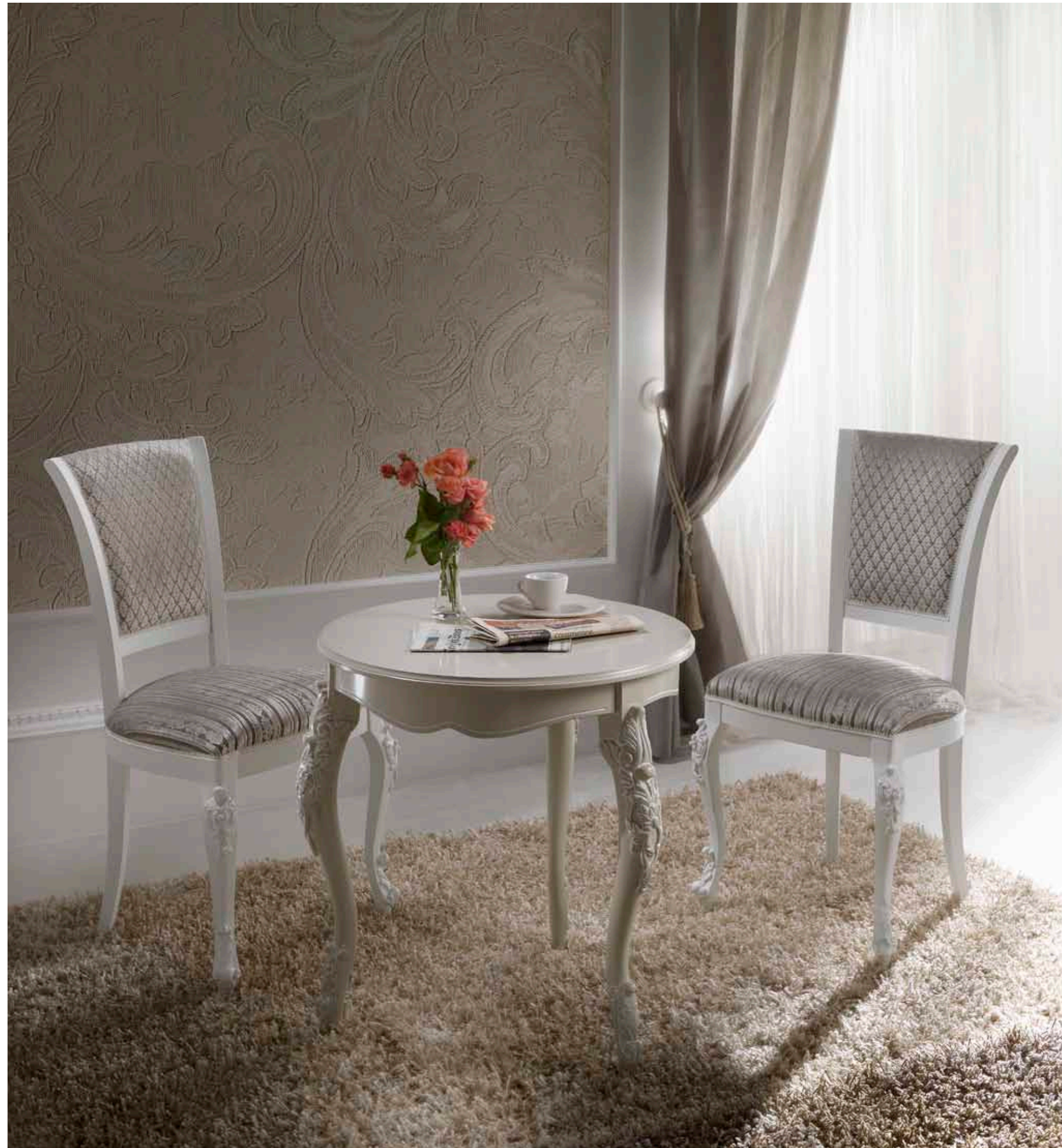
Art.1069T - Tavolino / Coffee table - cm.Ø 70 x 75H