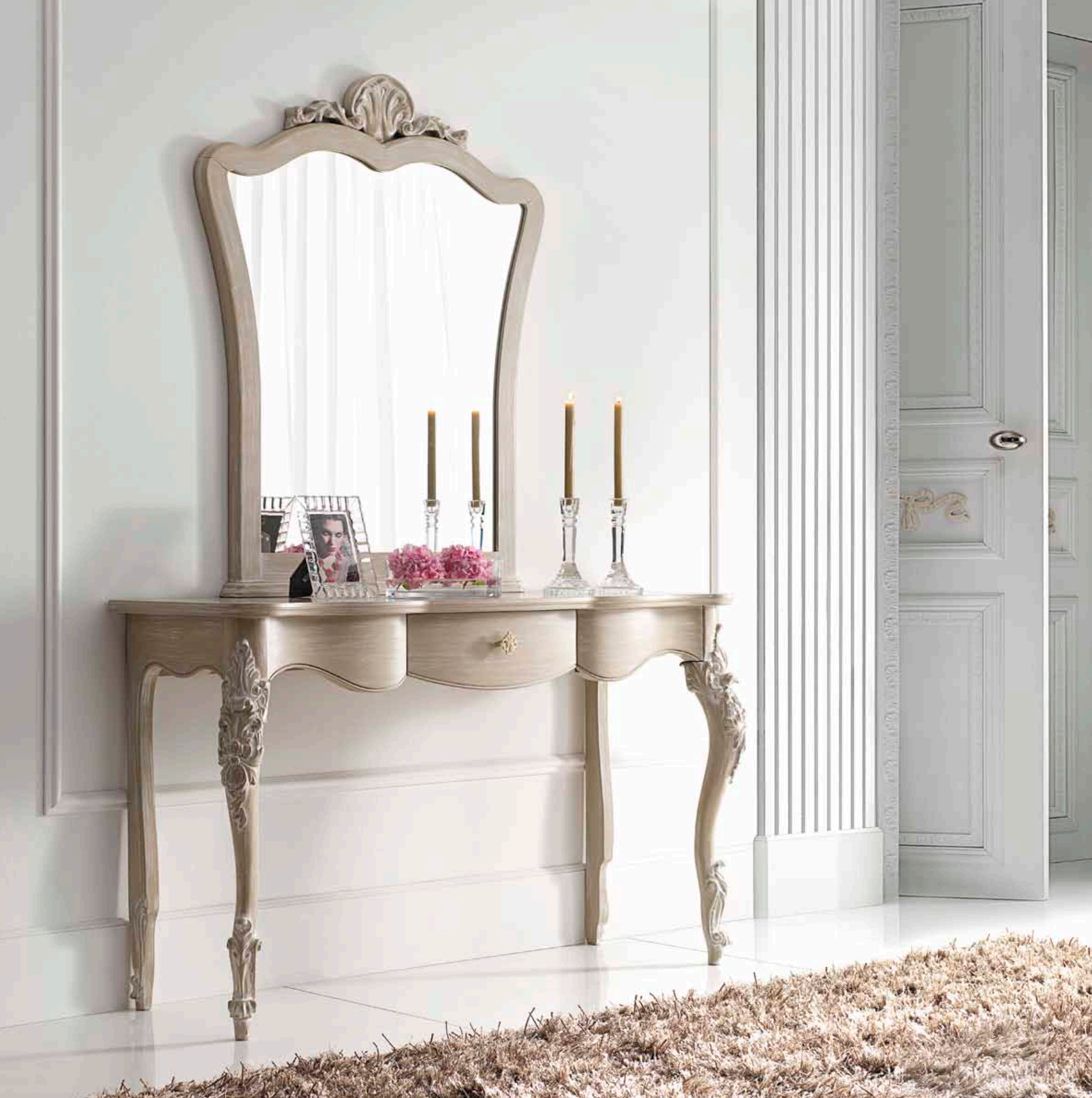
Art. 1014T - Consolle / Console - 142 x 46 x 83H