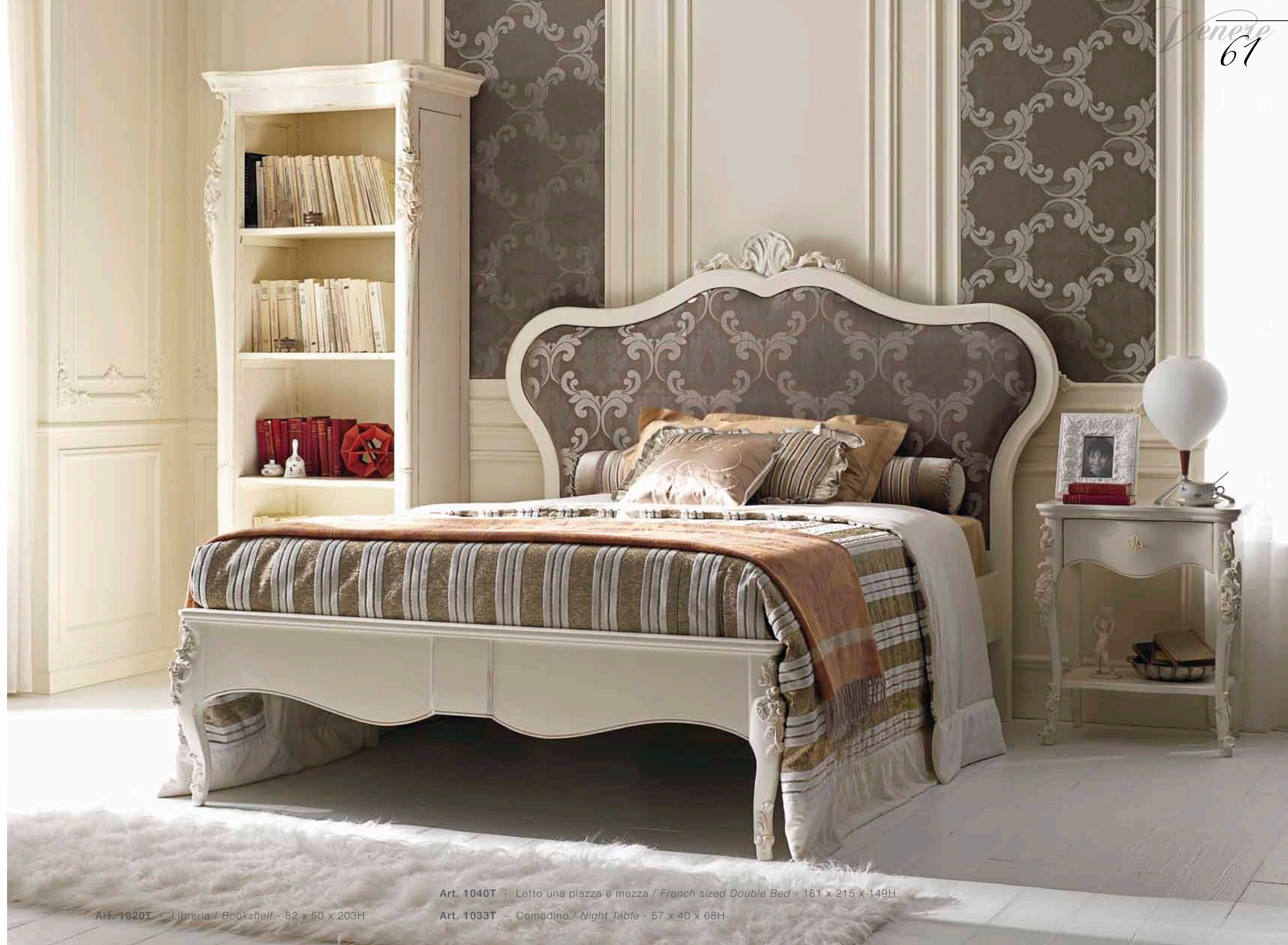
Art. 1020T - Libreria / Bookshelf - 82 x 50 x 203H

Upholstered headboard and decapè finish define a style of furniture that recalls the ancient with understated elegance, in a warm and relaxing atmosphere that makes you feel protected in a tender embrace. The French sized double bed, is more comfortable for a adult or teenager compared to a single bed, and less demanding than a normal double bed.