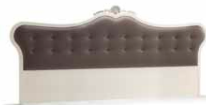
Art. 1043T Testiera letto Headboard 340 x 5 x 150H