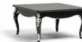
Art. 1013T Tavolino da salotto quadrato Square Coffee Table 90 x 90 x 48H