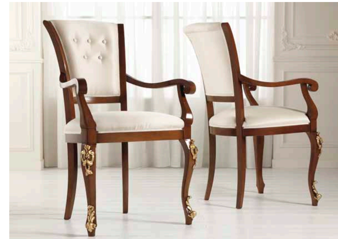
Art. 1005T - Sedia Capotavola / Armchair - 64x62x101H - tessuto/fabric "Siria"